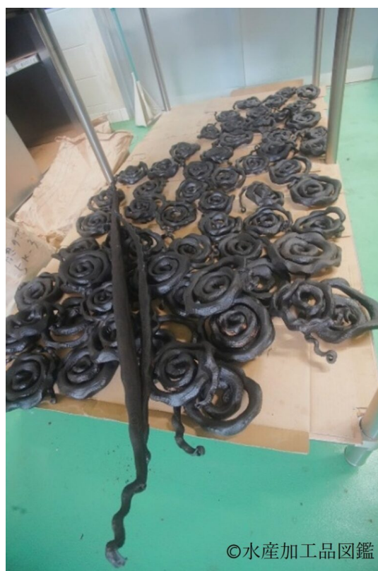
写真11 保管中のいらぶー