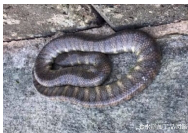
写真2 陸上で休憩するエラブウミヘビ