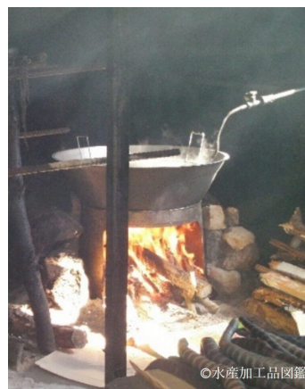
写真7 煮熟用なべ