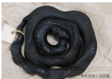
写真1 いらぶー