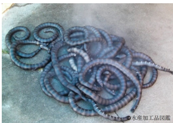
写真8 煮熟後のエラブウミヘビ