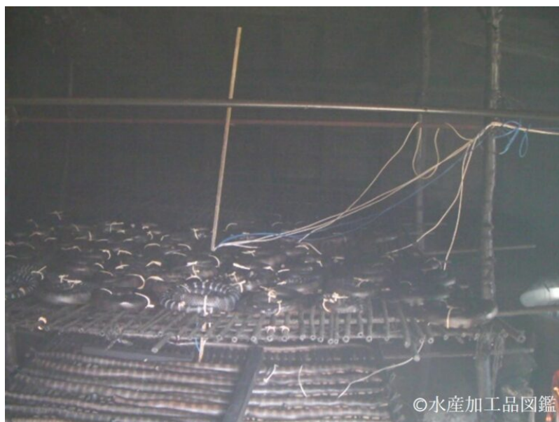
写真10 焙乾初期の様子

並べる（写真10）。火床にはモンパノキ葉、アダンの実、モクマオウ、テリハボクの幹を用いる。焙乾工程は6日間行い、2日毎に火床を作りなおす。小屋の温度が冷めて落ち着いたら取り出す。