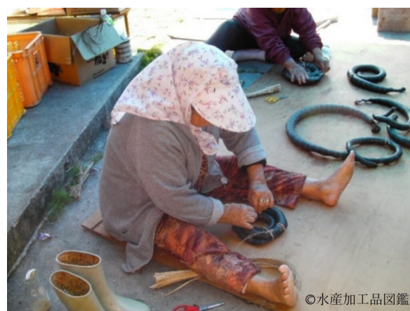
写真9 成形作業