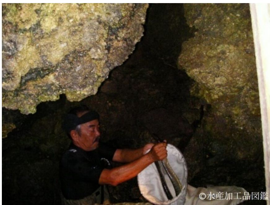
写真4 ガマでエラブウミヘビを捕獲する