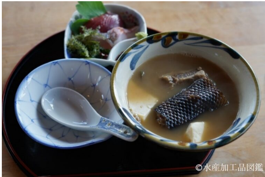
写真13 いらぶー汁