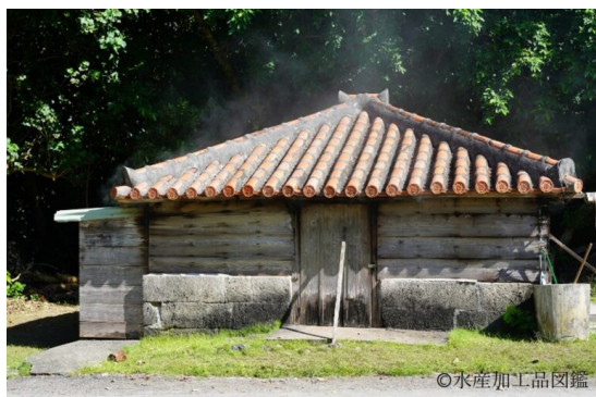
写真6 バイカンヤ