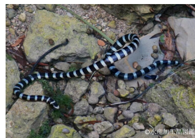
写真3 アオマダラウミヘビ