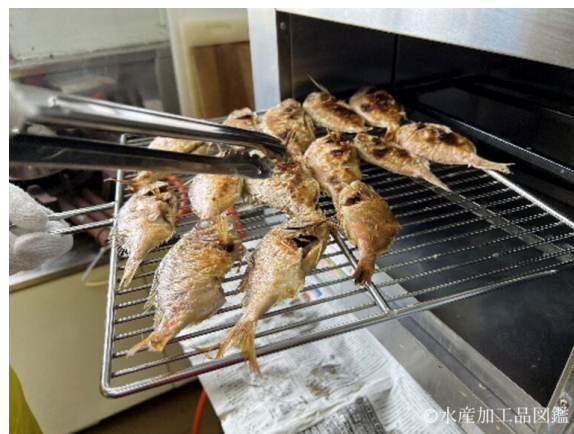
写真5 チダイの両面に焼き色をつける