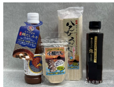
写真3 小鯛だしと関連の製品