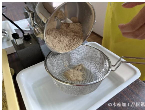
写真7 粉碎した後、ザルでふるう