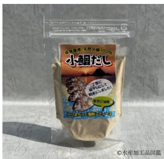
写真2 商品化した小鯛だし