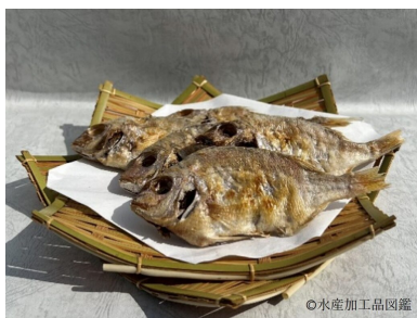
写真1 小鯛（チダイ）の焼き干し