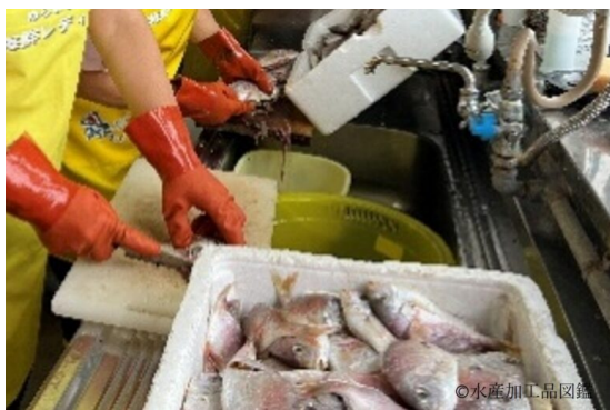
写真4 チダイの内臓を手作業で除去