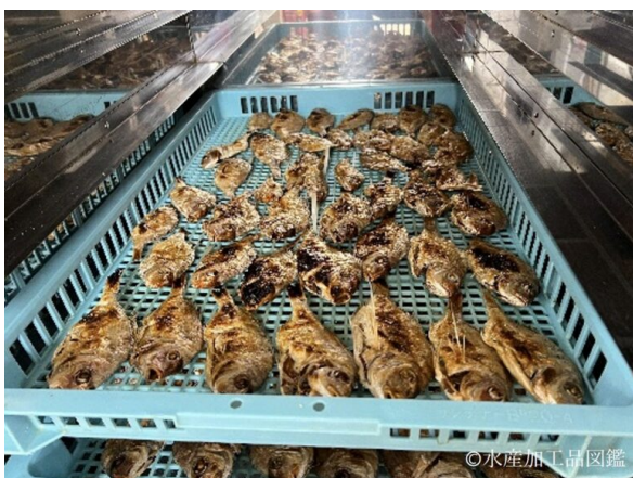
写真6 乾燥の様子