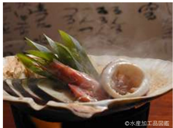
写真4 いしりの貝焼き