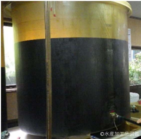
写真1 発酵樽の様子