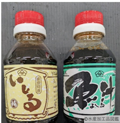
写真3 製品

刺し身、焼き魚の調味料として、その他野菜などの煮物の調味料として使われる。また、ホタテガイの殻に大根やナスなどを入れ、いしりで風味を付けただし汁を入れて焼く「いしりの貝焼き（写真4）」、ナスなどの野菜をいしりで漬けた「べん漬け」なども能登の郷土料理である。最近ではいしり入りのアイスクリームもネット販売されている。