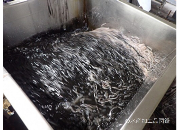
写真4 調合