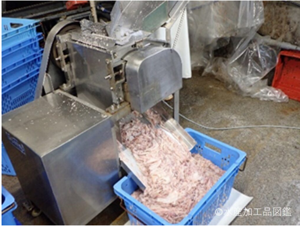
写真3 イカの細切