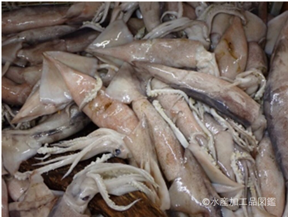
写真1 黒作りの原料スルメイカ