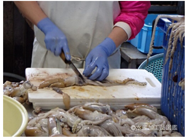
写真2 内臓などを除去