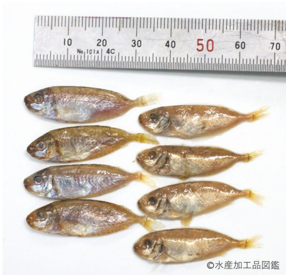
写真1 スクガラス原料（アイゴ稚魚） 左：新鮮な魚体、 右：塩漬後の魚体