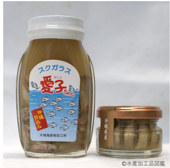
写真2 すくがらす製品