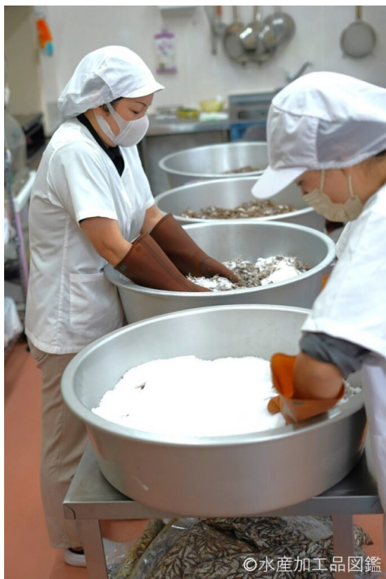
写真7 塩混ぜ