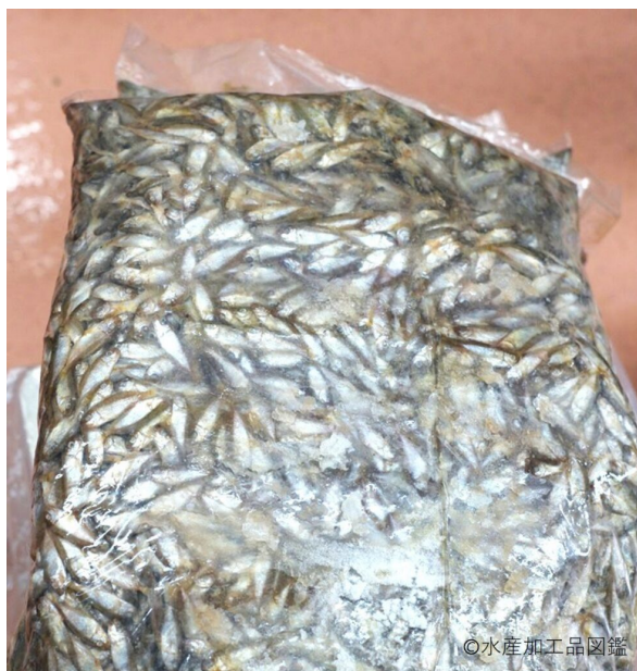
写真3 冷凍原料