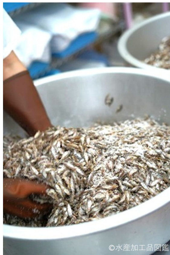
写真8 塩混ぜ