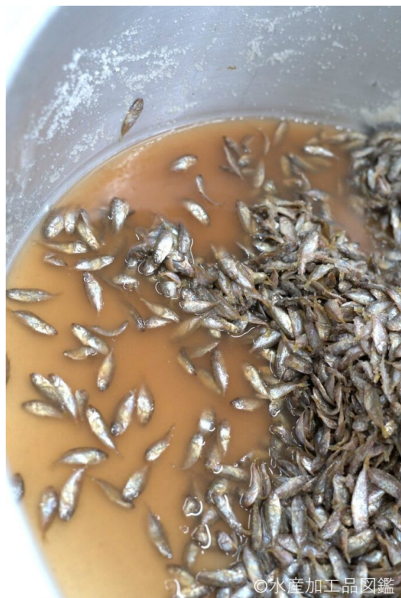
写真9 ペール缶で熟成