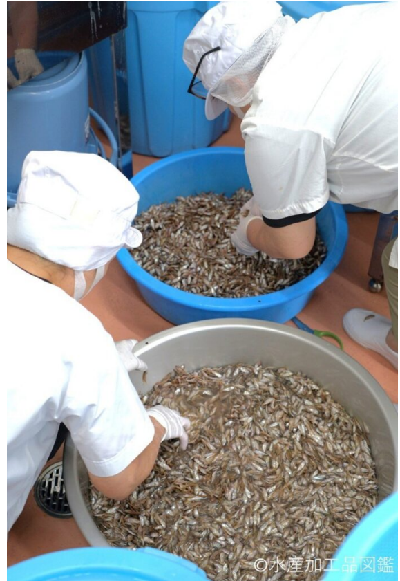
写真6 選別