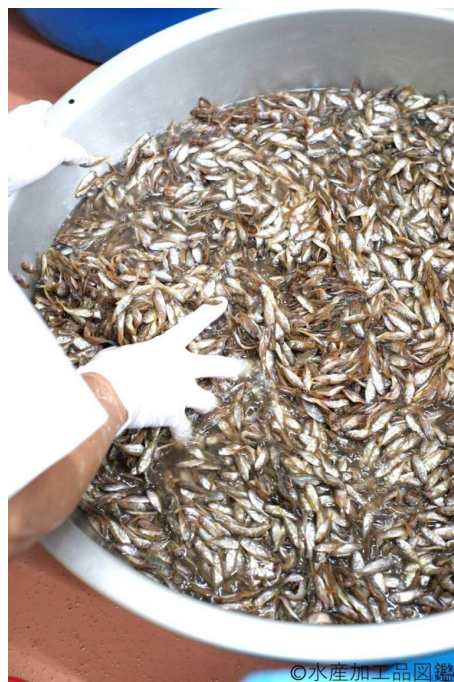
写真4 塩水洗浄