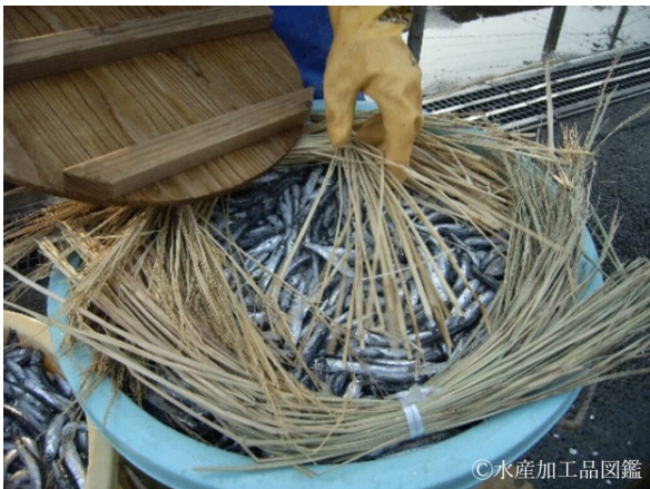
写真5 上から藁を敷き詰める