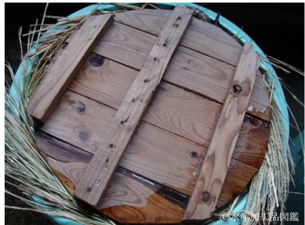
写真6 中蓋を敷く