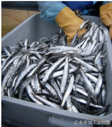
写真3 カタクチイワシと塩を手で混合する