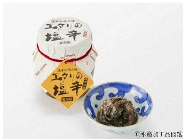
写真8 えたりの塩辛製品パッケージと その盛り付け例