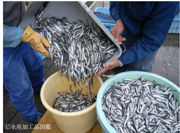
写真4 混合したものを樽に移し替える