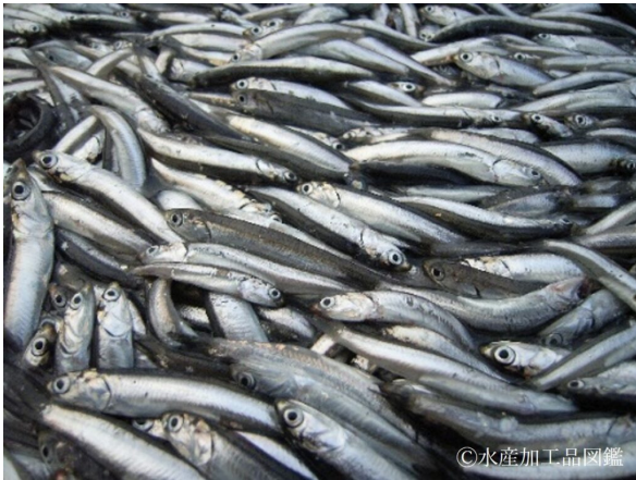
写真1 原料となるカタクチイワシ