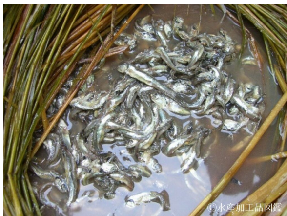
写真7 熟成が完了した様子