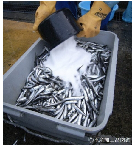
写真2 カタクチイワシと塩を計量する