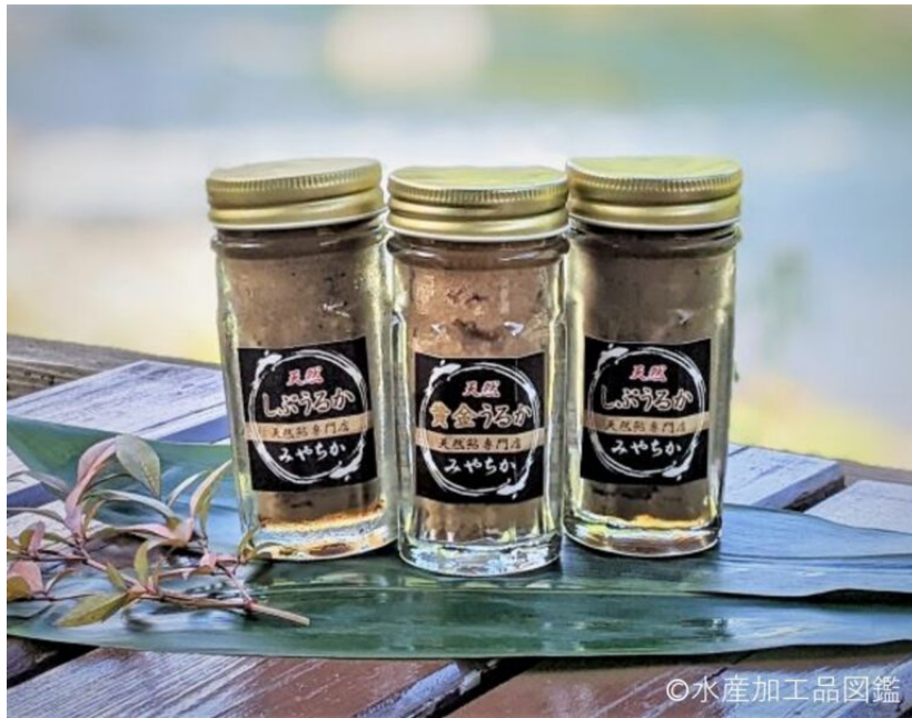
写真6 製品（真子うるか：中、渋うるか：両端）（提供元：みやちか）