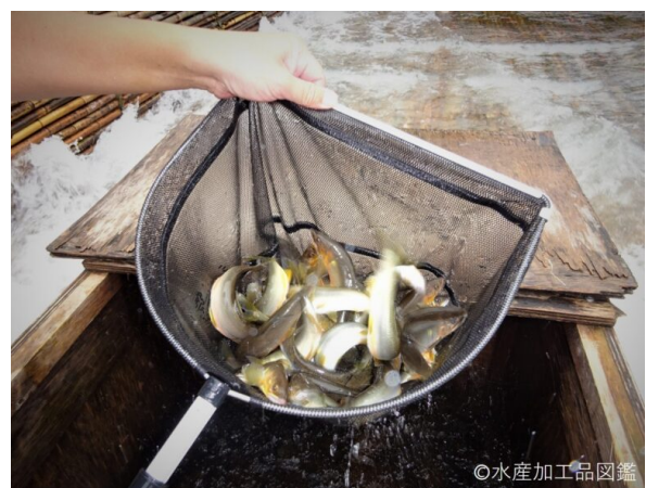
写真2 落ち鮎