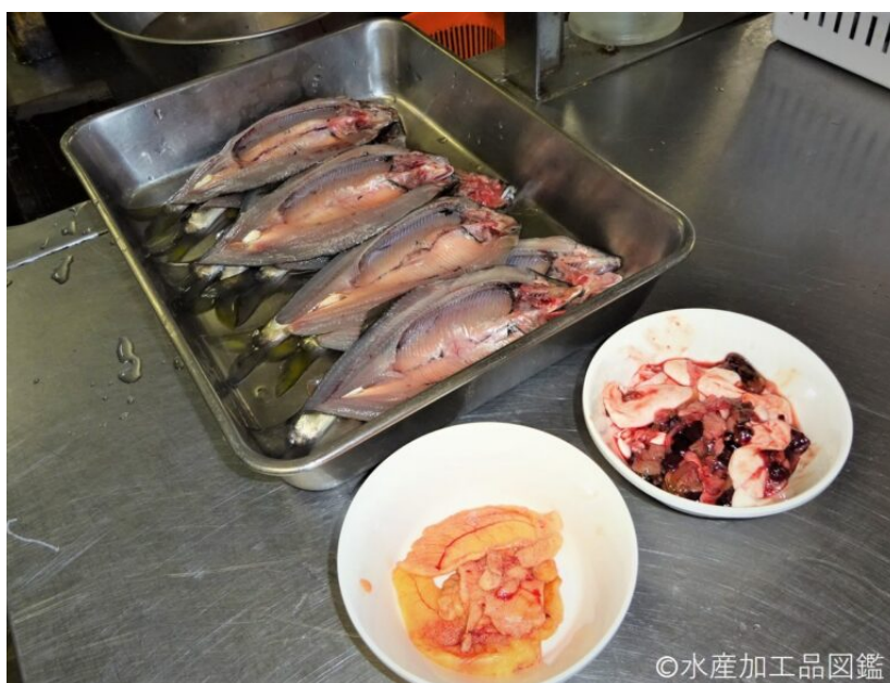
写真4 卵巣と内臓の選別