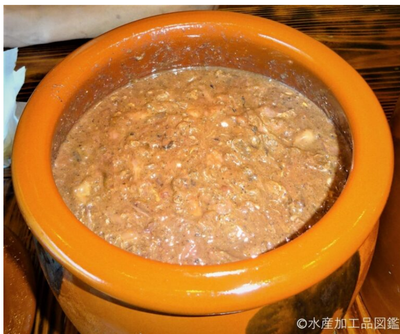
写真5 熟成中のうるか