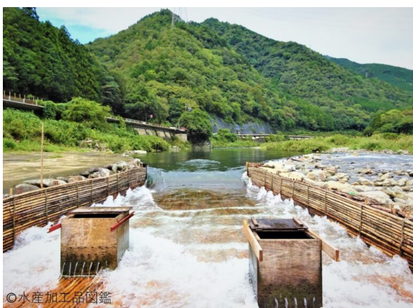
写真1 ヤナ場漁

10月上旬にヤナ場（写真1）で漁獲された天然の「落ち鮎」（写真2）を用いた製造例は下記のとおりである。