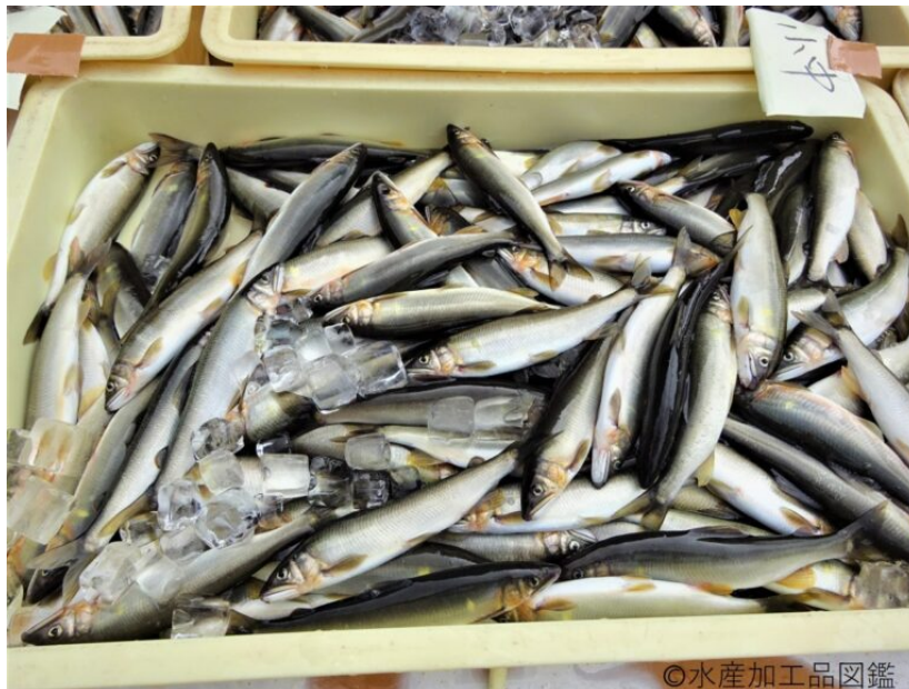
写真3 原料魚

が観られる。10月下旬になると多い日で3万尾の落ち鮎が漁獲され、谷水を引き入れたプールに2～7日間ほど活かし、砂を吐かせる。その後、水水で締められ、サイズと雌雄を選別する。70g以下の中小サイズ（写真3）が一夜干し、むしり（雑炊・茶漬け・炊込みご飯等に用いるほぐし身）等の加工原料とされ、それ以上のサイズのものは料理或いは鮮魚として利用される。