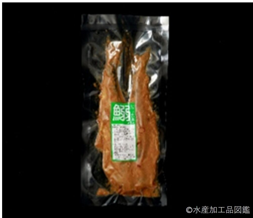
写真2 いわしぬか漬け製品