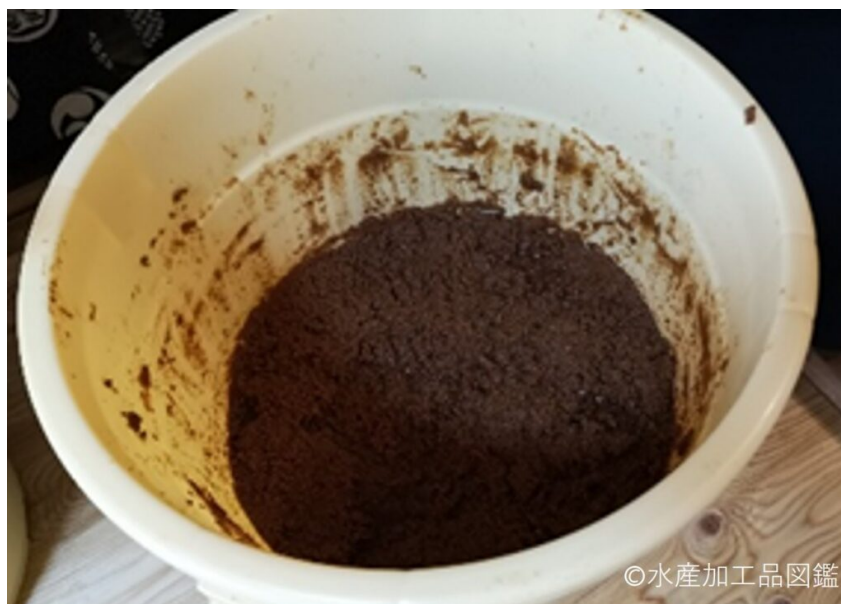
写真1 糠漬けの様子