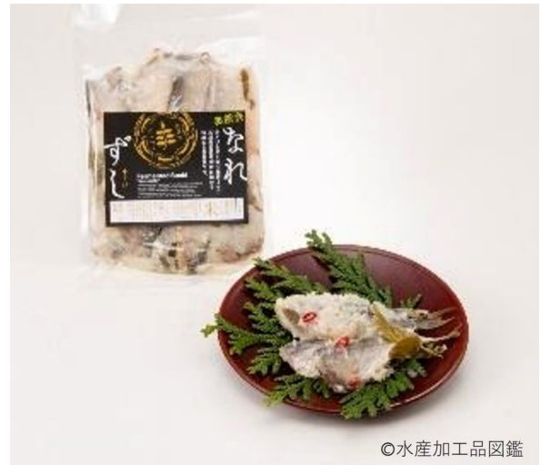
写真3 製品 (提供：NPO法人当目)