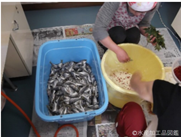
写真1 漬け込みの様子①

頭ごと丸かじりするのが一番おいしい食べ方と言われる。樽から出したものは早めに食する。