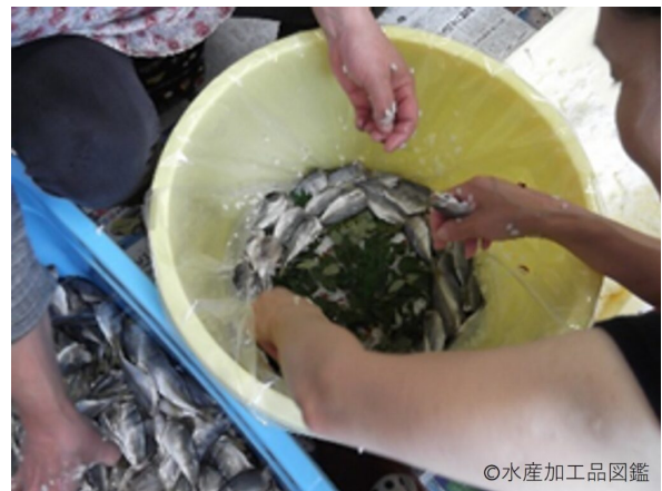
写真2 漬け込みの様子②