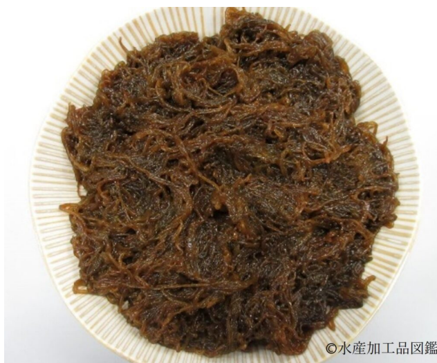
写真1 塩蔵もずく

塩蔵もずく（写真1）は、オキナワモズクを収穫後に洗浄し、塩漬けにした製品である。塩漬けにすることで水分が抜けモズク自体の重量が増すため保管や流通に適しており、冷蔵・冷凍技術が向上した現在でも、生よりも塩蔵で保存することが多い。なお、塩蔵もずくは冷凍すると数年間保存することが可能である。