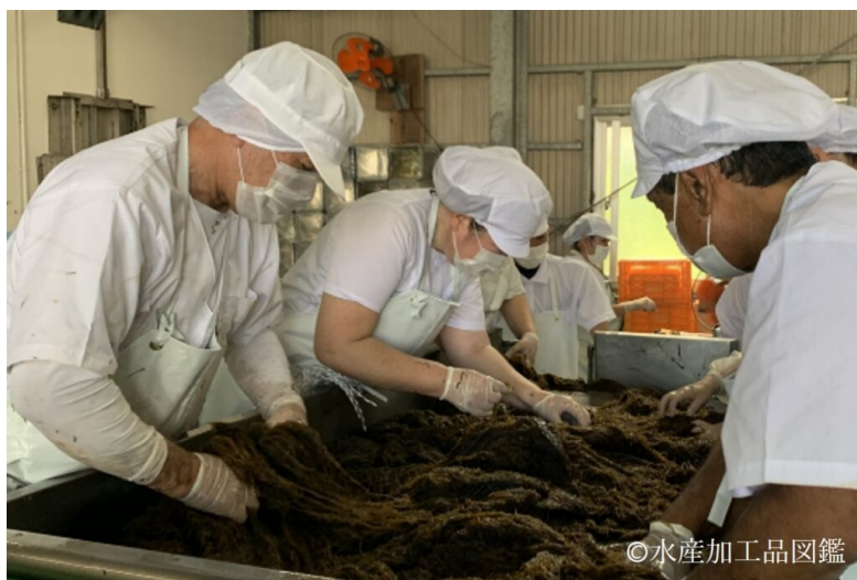
写真3 塩蔵もずくの製造風景（異物除去）