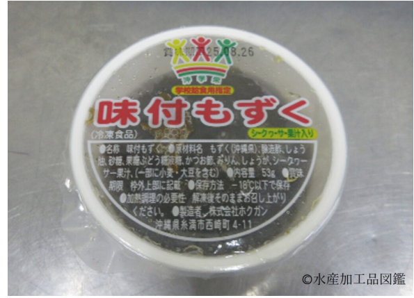
写真5 もずくの酢の物