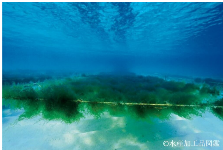
写真2 オキナワモズク養殖風景

モズクの養殖は1979年頃から盛んになり、その後モズク生産量が急激に増加するとともに、国内各地での需要も増加したことから、塩蔵もずくが製造されるようになった。現在でもモズクの流通形態は塩蔵もずくが主流であるが、ヌメリ分の多い生もずくの需要も増加している。また、流通コストの低減と保存に有利な乾燥もずくも製造されている。