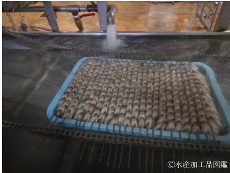
写真4 水洗い工程