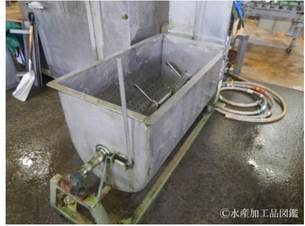
写真2 魚洗機 1回に約150kgのハタハタを洗うことができる。