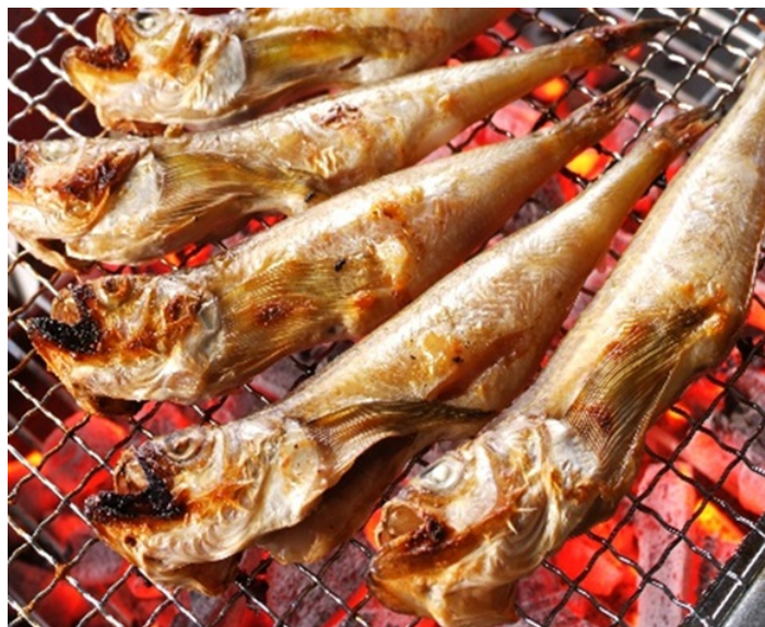
写真8 焼いた一夜干しはたはた (提供：株式会社 蔵平水産)

そのまま焼いて食べるのが、一夜干しはたはたのおいしさを最も良く味わえる。皮はこんがり、身はふわりと焼くためには、炭火で強火で焼くか中火で網やロースターにゆったり並べて少量ずつ焼くのがコツである。好みにレモン・大根おろし・マヨネーズ等を添えて食べる。焼いた身をほぐして温かいご飯の上に載せて、わさび・醤油少々を加えて食べても美味しい。ほかには、煮付け、フライ、唐揚げにして甘酢をかけて食べる方法もある。