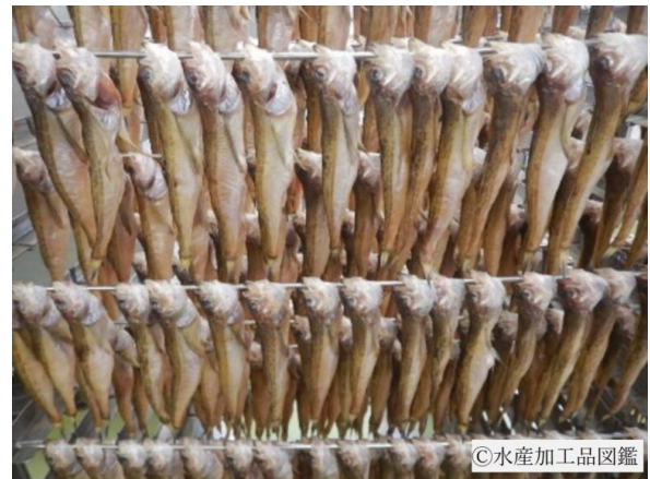
写真6 乾燥工程