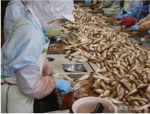
写真1 調理工程