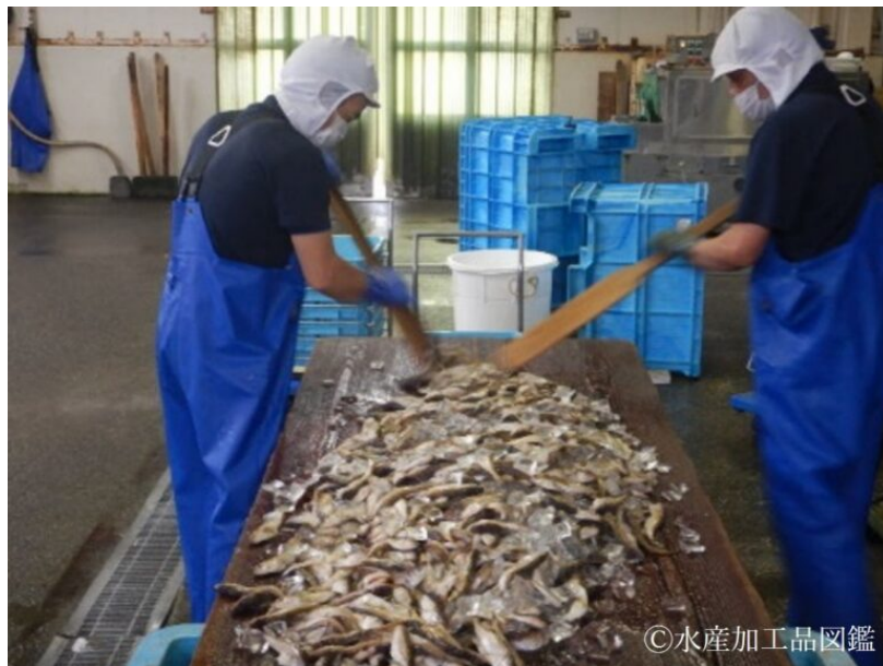
写真3 振り塩工程