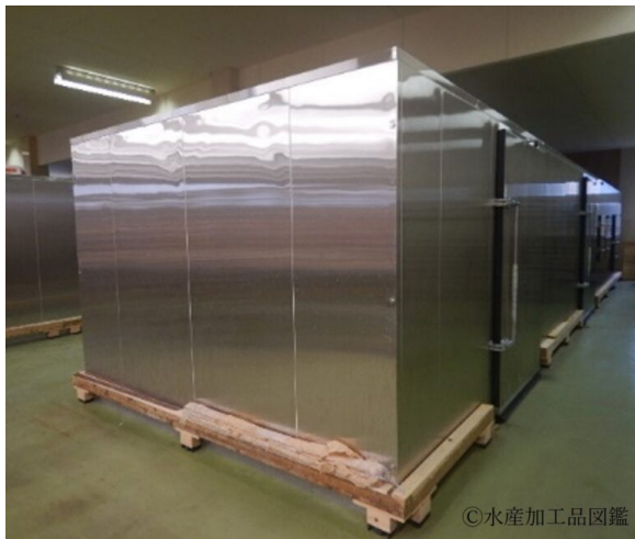
写真5 冷風乾燥機 一度に約700kgのハタハタを乾燥できる。