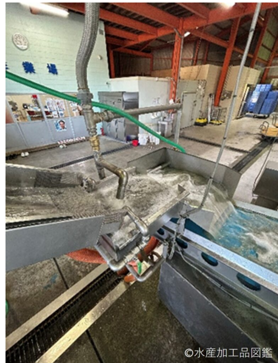
写真7 真水で洗浄