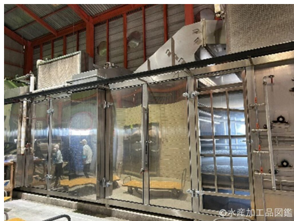
写真10 乾燥機