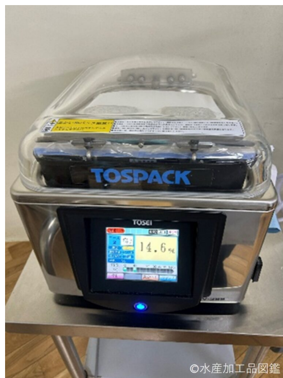
写真12 真空包装機