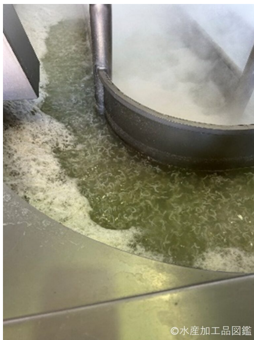
写真8 煮熟風景