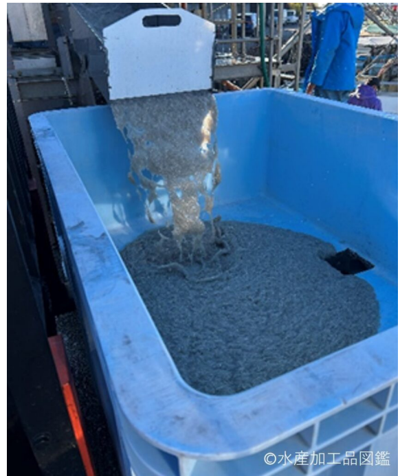
写真5 水揚げされる原魚