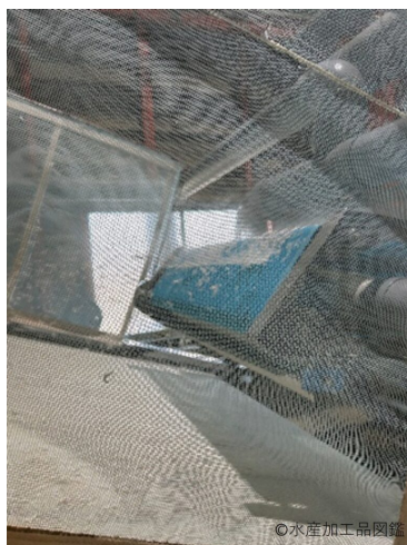
写真9 重ならないように広げる