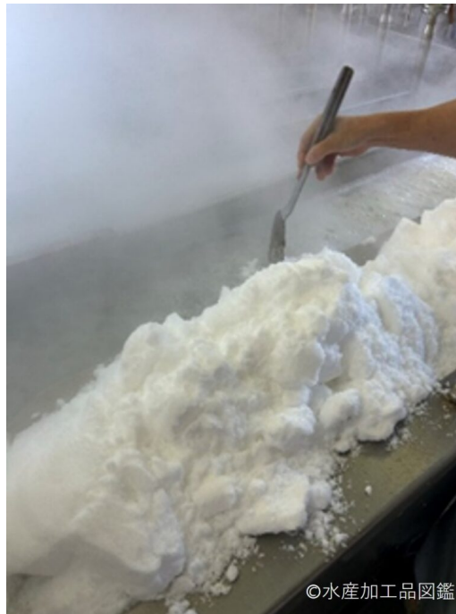
写真3 塩分濃度を調整している様子