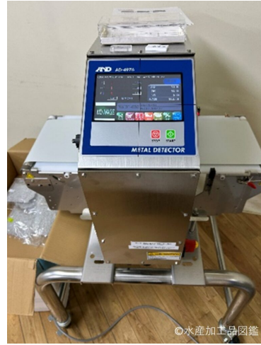
写真14 金属検出器