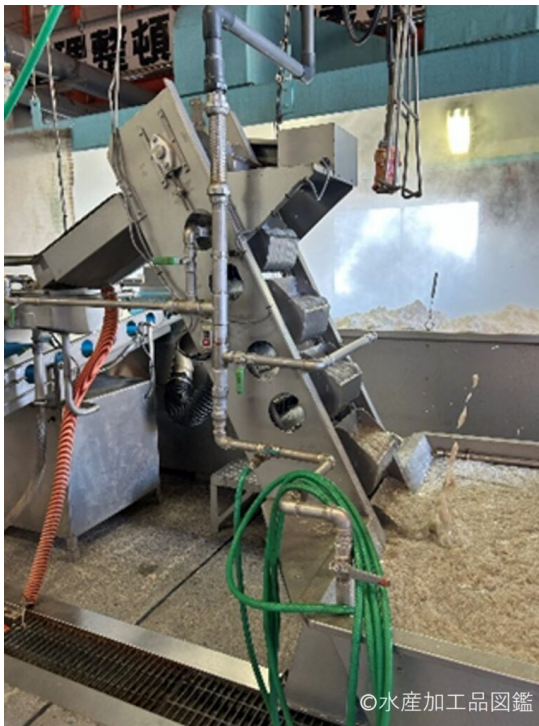
写真6 定量をくみ上げてレーンに流す