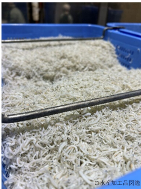
写真1 製造されたちりめん