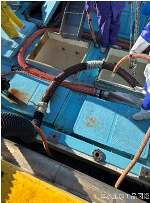
写真4 フィッシュポンプ