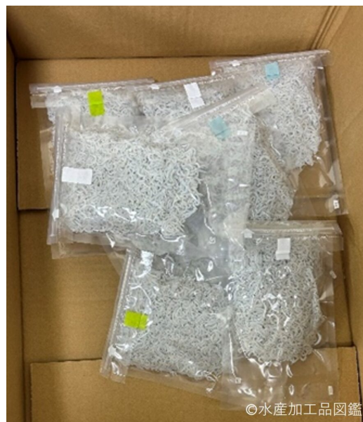
写真15 包装されたちりめん

上干はプラスチックのフィルムで包装されている。やわ干しや釜揚げはプラスチックトレーで包装されていることが多い。業務用は段ボール箱に紙を敷き、箱詰めして出荷されている。冷蔵で保管し、開封後は乾燥を防ぐため密閉した方が良い(写真15)。