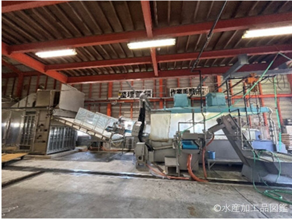
写真13 ちりめん製造プラント