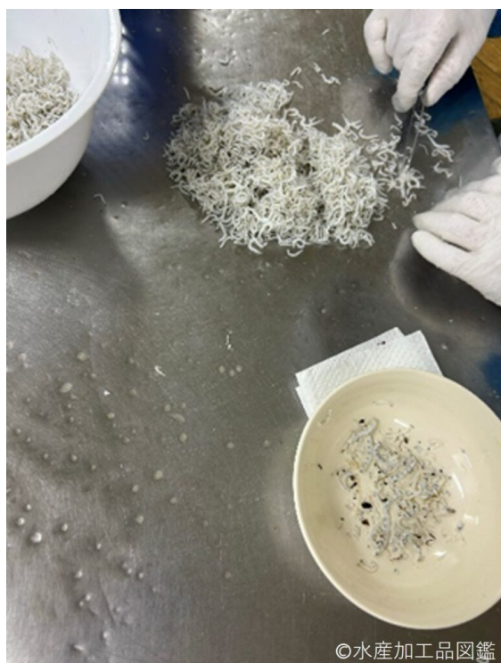
写真11 異物除去の様子