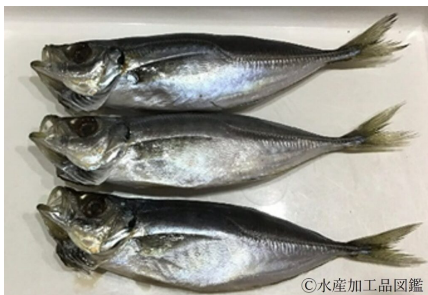
写真1 あじ丸干し