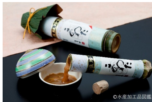
写真2 このわた製品