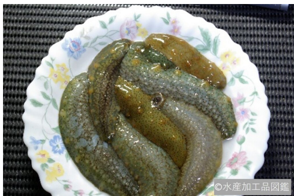
写真1 アオナマコ

は器に少量入れ、鶉の卵を割り入れて供されることもある。空になった竹筒に熱澗を入れた「このわた酒」は一層風味が増して格別である。