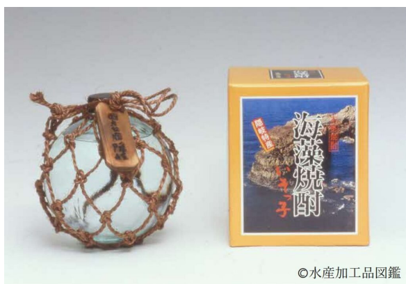
写真2 海藻焼酎の製品