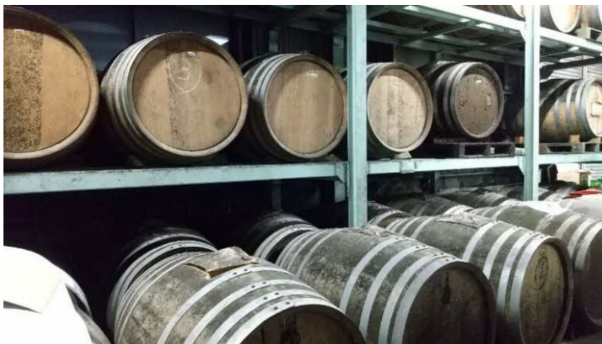
写真1 樽で保管される海藻焼酎