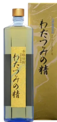
写真3 樽で長期熟成させた製品