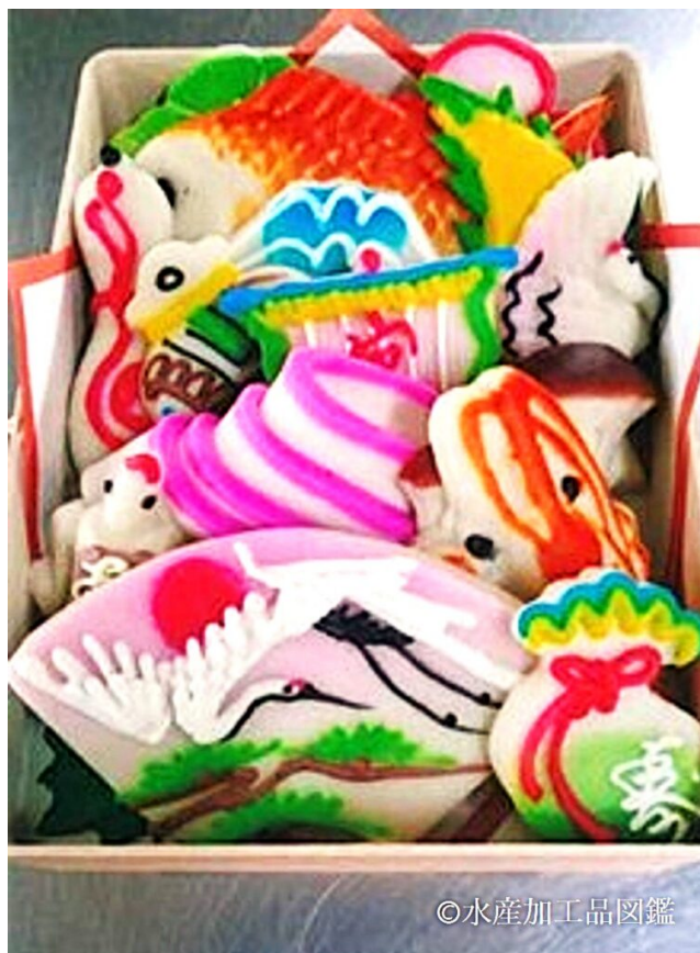
写真1 各種の細工かまぼこ