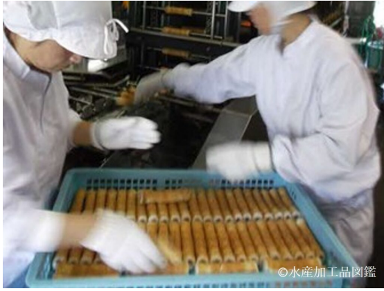
写真4 串抜き