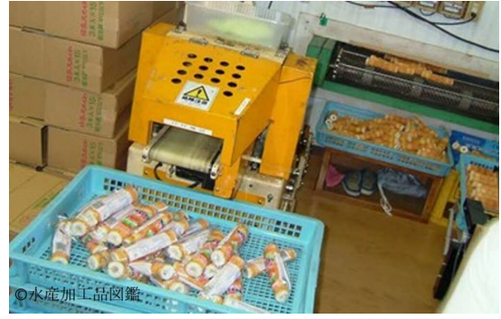
写真5 包装