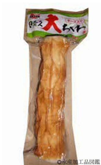
写真6 日奈久ちくわの製品