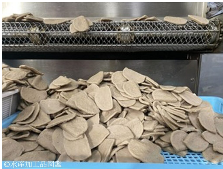
写真3 冷却工程