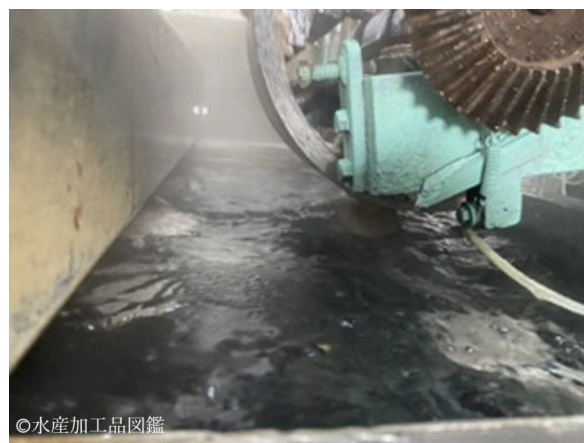
写真1 搗潰工程