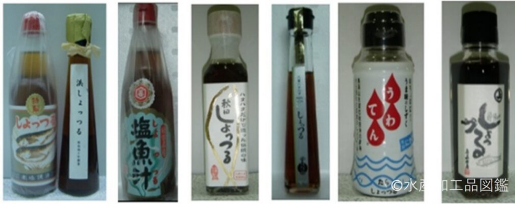
写真3 主な市販しょう油