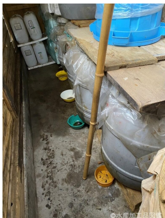
写真2 かき混ぜ棒