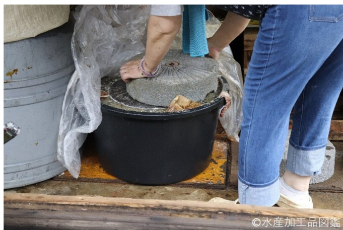
写真5 塩漬け中のスルメイカ