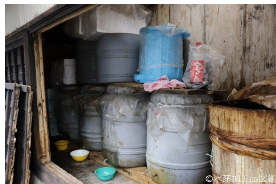
写真3 熟成中の熟成樽