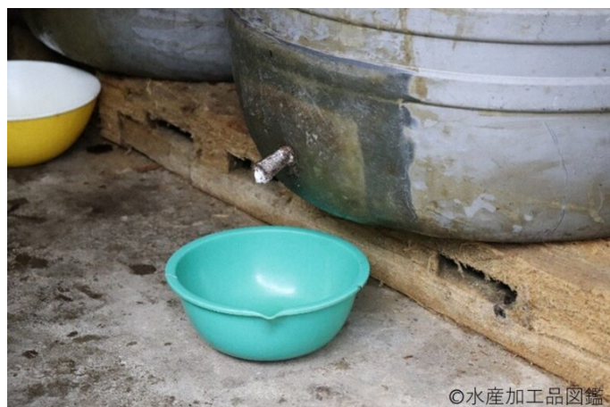
写真4 つゆ抽出口