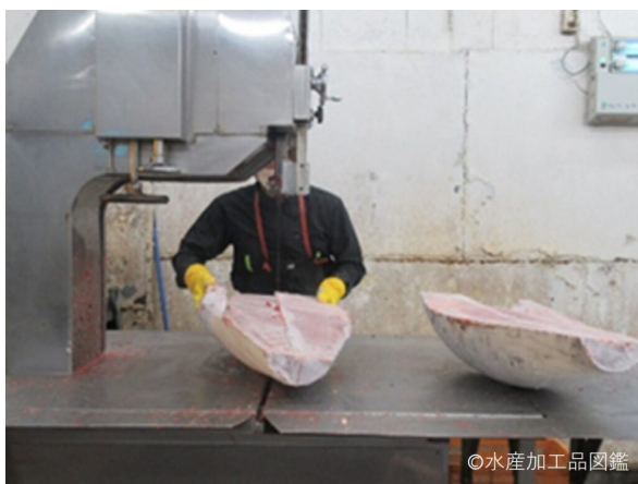
写真1 裁割機