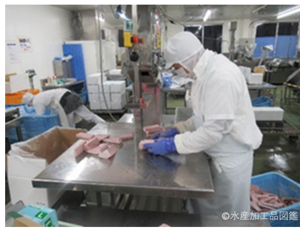
写真2 裁割