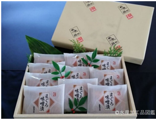
写真5 製品の例