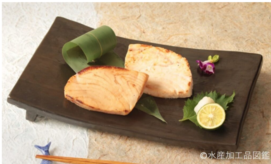
写真7 かじき味噌漬け

また、シロカジキなどを使用した高級品については「ミディアムレア」の焼き方も可能であり、味噌を水で洗い流して水分をふき取った後、中火で熱したフライパンにクッキングシートを敷き、片面1分、裏返して1分火を通し、しっとりとした柔らかな口当たりに焼き上げる。