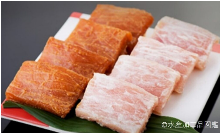
写真8 左 かじき味噌漬け 右 カジキ粕漬け