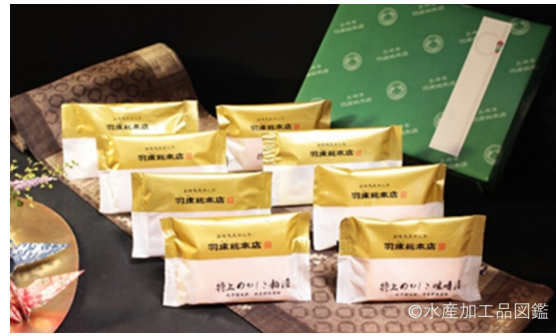
写真6 製品の例