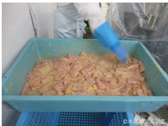
写真3 漬け込み