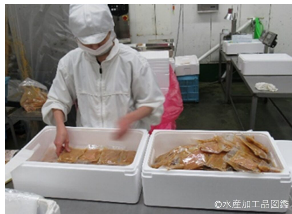
写真4 包装・梱包