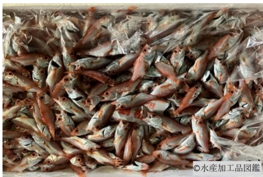
写真1 原料のアカムツ（ノドグロ）