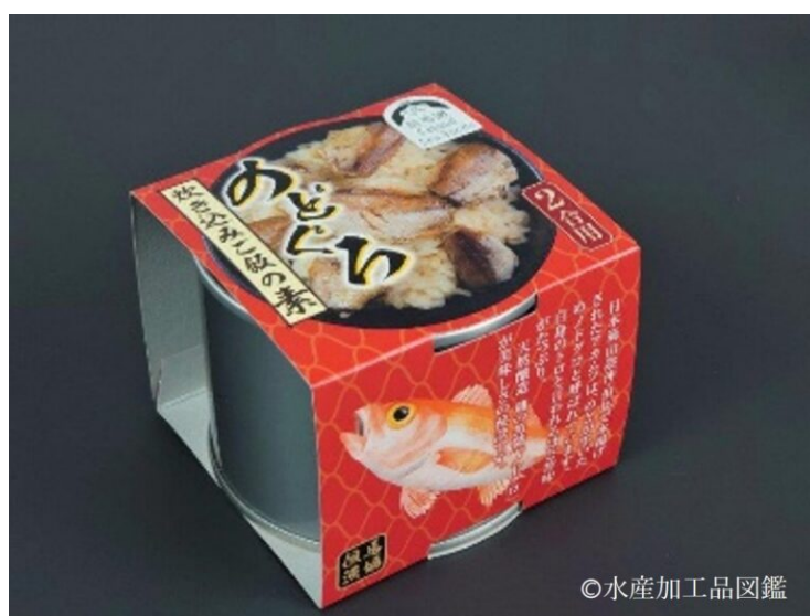
写真2 のどぐろ炊き込みご飯の素缶詰

原料入荷・保管 → 魚類解凍・検品 → 原料解凍後洗浄（水道水） → 食材調理（煮沸・焼き入れ等） → 調理済食材の金属探知機による検査 → 食材及び調味液の充填計量（目視検査） → 真空巻き締め → 高圧高温殺菌工程（120℃ 35分） → 冷却 → 乾燥 → 缶底部賞味期限及びロット記号印字 → 静置 → 出荷前検査（缶形状等目視検査） → 梱包 → 出荷