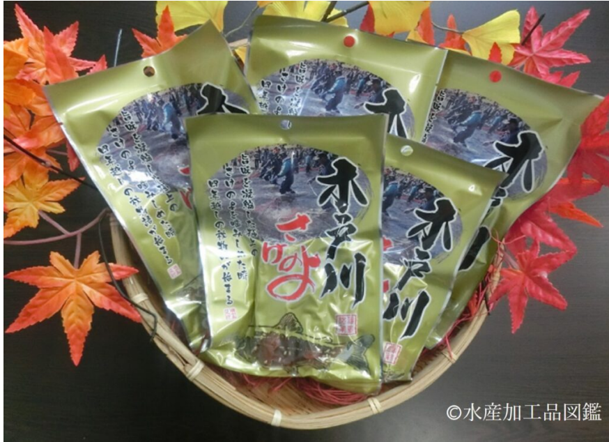
写真2 ソフトとば包装品