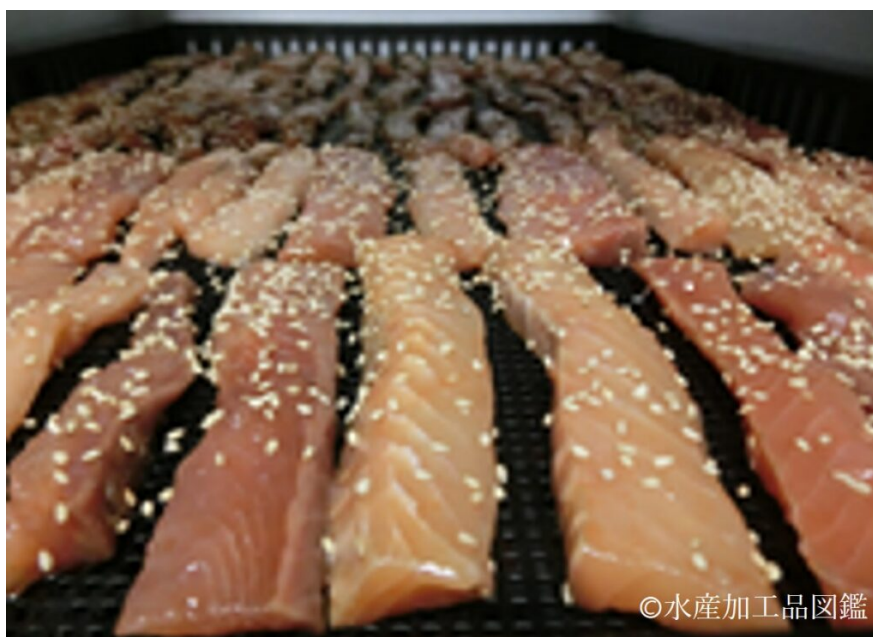
写真1 乾燥中のソフトとば