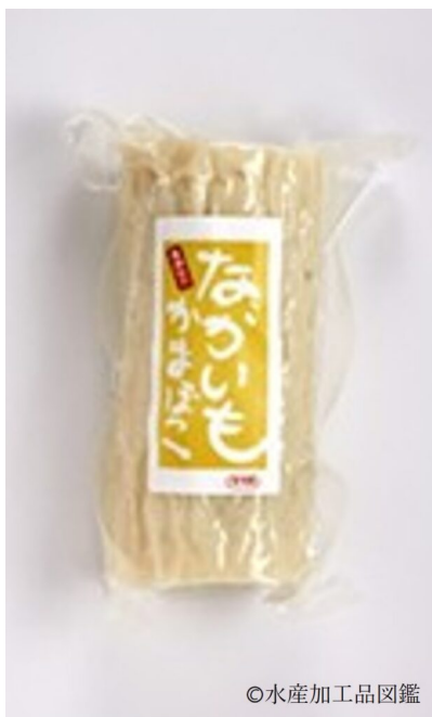
写真3 真空包装した製品