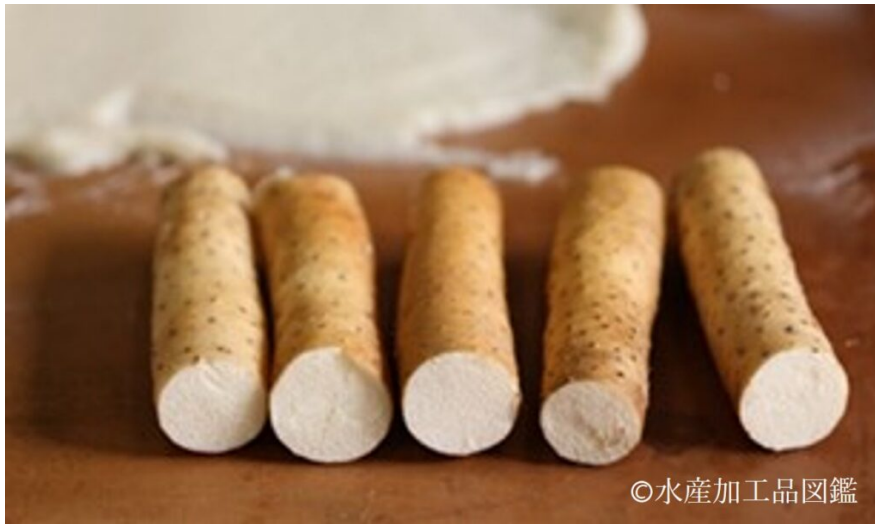
写真2 砂丘長いも