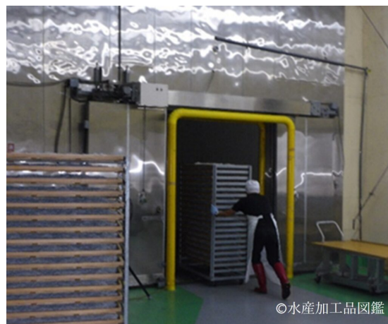
写真6 放冷のために冷却設備へ移動