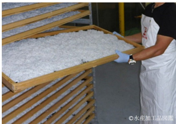
写真5 干し網に載せられた煮熟後のシラス （提供：株式会社 安重水産）