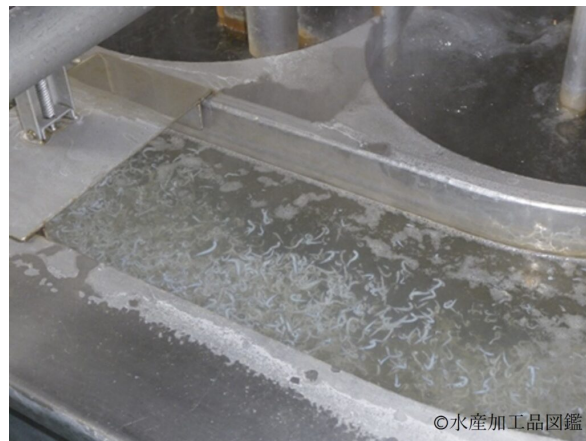
写真4 自動煮熟釜で煮熟されるシラス