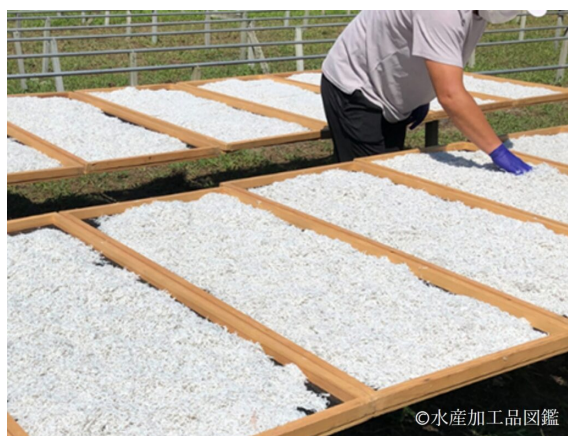
写真7 天日干し