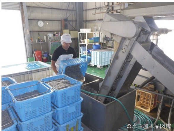
写真3 洗浄槽への投入