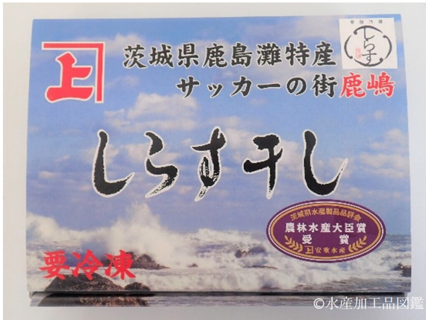
写真10 しらす干し製品の包装済みパッケージ

業務用はしらす干しを薄いビニールで包み段ボール箱に入れて出荷される。小売り用は、100～200g程度をトレーに入れラップで包装したり、蓋付きのプラスチックトレー等に入れる。(写真10)