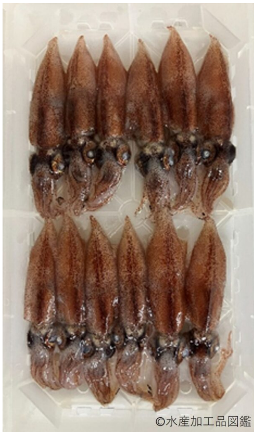
写真1 原料のホタルイカ