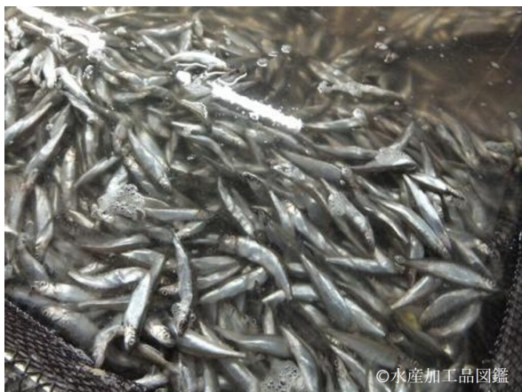
写真2 製造風景1 (原料魚の解凍)