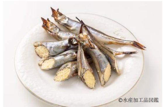
写真12 調理例2 (焼き②)