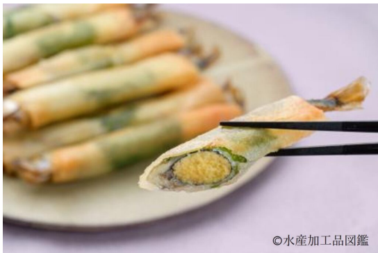
写真15 調理例5 (春巻き)