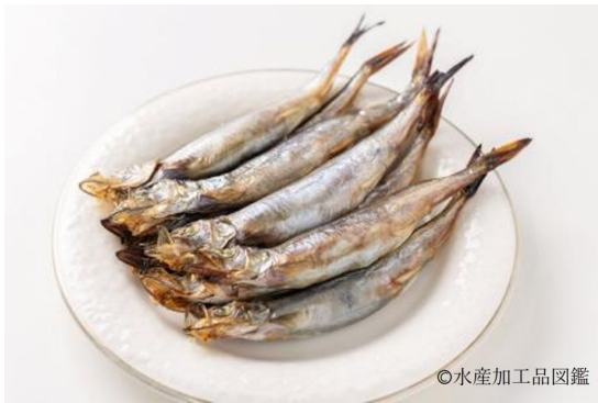
写真11 調理例1 (焼き①)