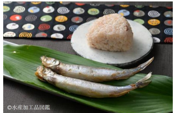
写真16 盛り付け例