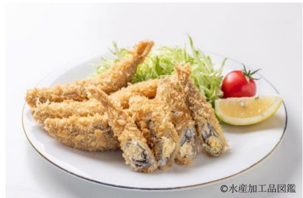
写真14 調理例4 (フライ②) (提供：株式会社ヤマシ)