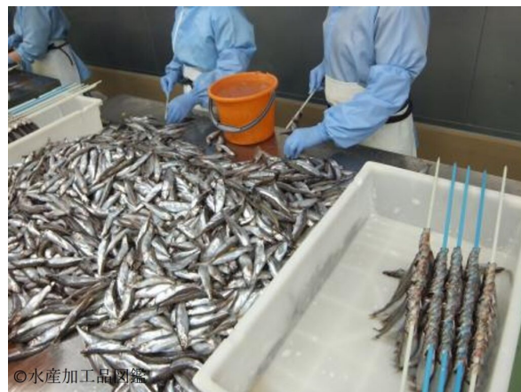
写真3 製造風景2 (生刺し)