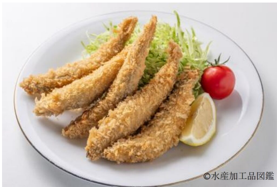
写真13 調理例3 (フライ①)