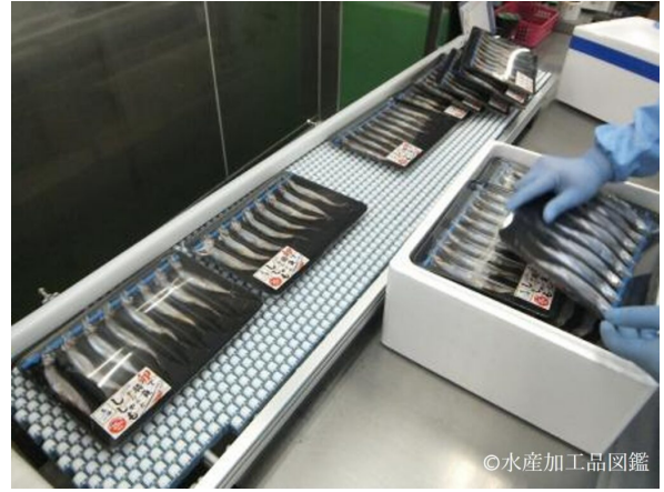
写真7 製造風景6 (シール貼りと箱詰め工程)