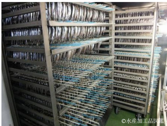
写真4 製造風景3 (乾燥工程)