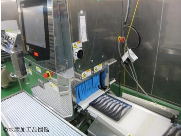
写真6 製造風景5 (X線検査工程)