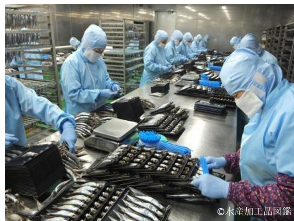
写真5 製造風景4 (トレー整列とストロー刺し) (提供：株式会社ヤマイン)