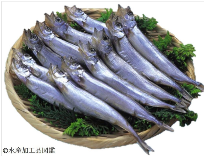
写真8 ししゃも塩干品 (カラフトシシャモ) の製品