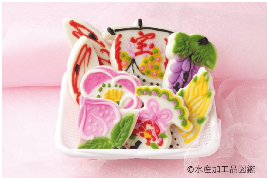
写真3 細工かまぼこ（祝儀用） 上 入学祝 下 婚礼用