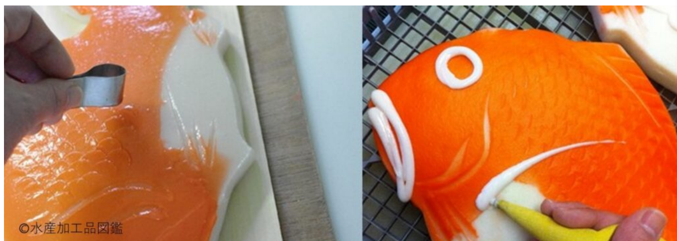
写真1 細工 左：鱗模様の細工 右：目玉、口、鰓の細工