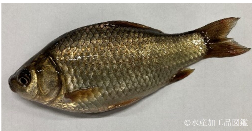
写真2 加工原魚のフナ

骨がやわらかく消費者に好まれる0年魚（その年に生まれた1年未満の魚）を選択するのがポイントである。また、製品にした際の見え目や歩留まりの良さから、体高の高いものを選ぶのが良い（写真2）。原料魚の選定基準は、体長7cm以上である。