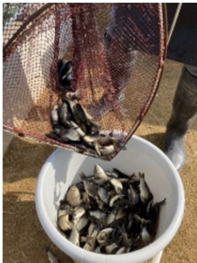
写真3 蓄養槽からの取りあげの様子（左：蓄養槽からの取り上げ、右：取り上げられたフナ）