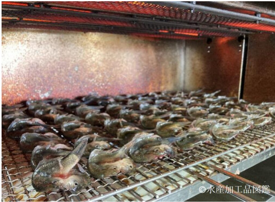
写真8 両面焼きの様子（片面ずつ）