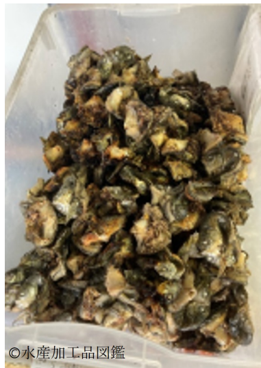
写真10 冷やし