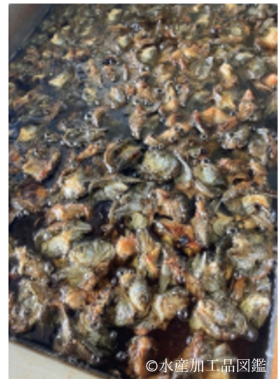
写真11 揚げ2回目