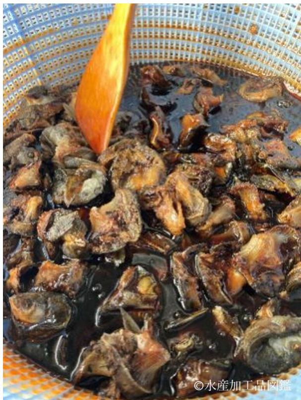
写真12 タレをからめる様子