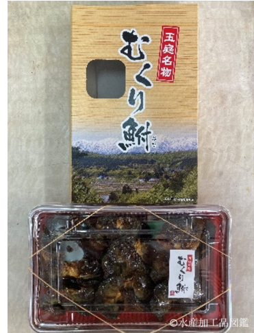
写真14 200gパック