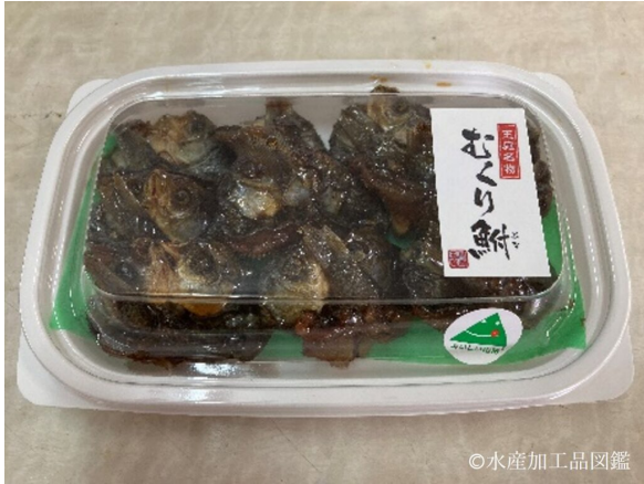
写真13 100gパック

専用の容器（写真13）で包装する。または、内容量200gの規格や大型のフナの場合は真空パックして包装する（写真14）。保存は冷蔵で行う。