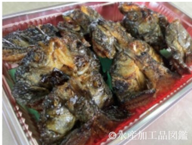
写真1 むくりぶな（左：100gパック、右：200gパック）