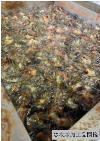
写真9 揚げ1回目