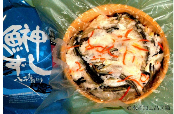
写真5 取り出し混合