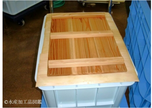
写真3 漬込原料準備