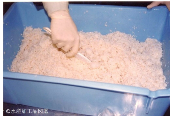
写真2 米飯・米麴混合