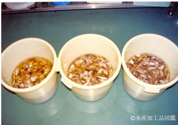
写真1 ハタハタ仮酢漬