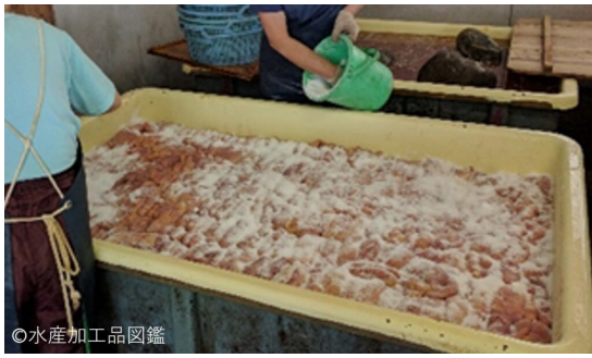
写真2 ふぐ卵巣糖漬けの様子