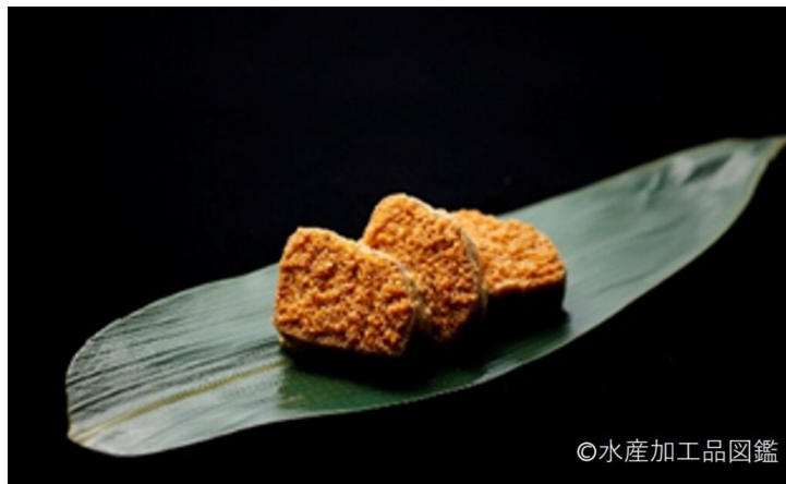
写真6 ふぐ卵巣糠漬けスライス