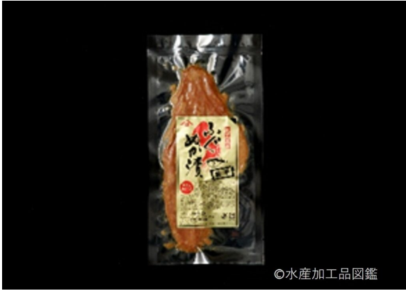
写真4 ふぐ肉糠漬け