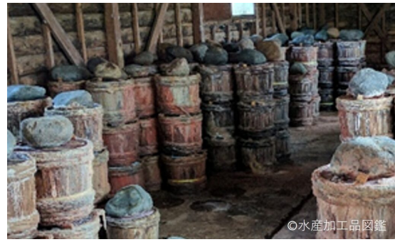
写真3 熟成の様子