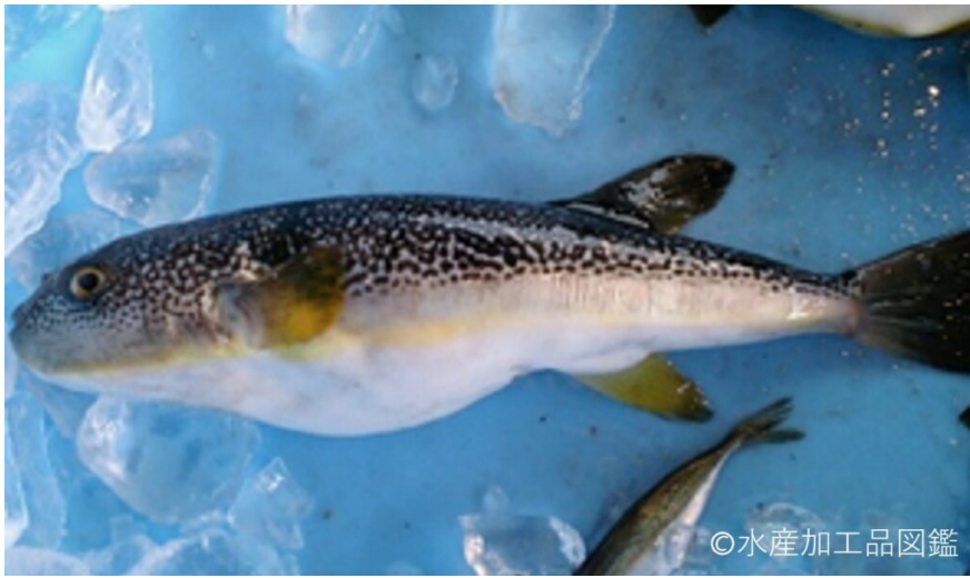
写真1 ゴマフグ