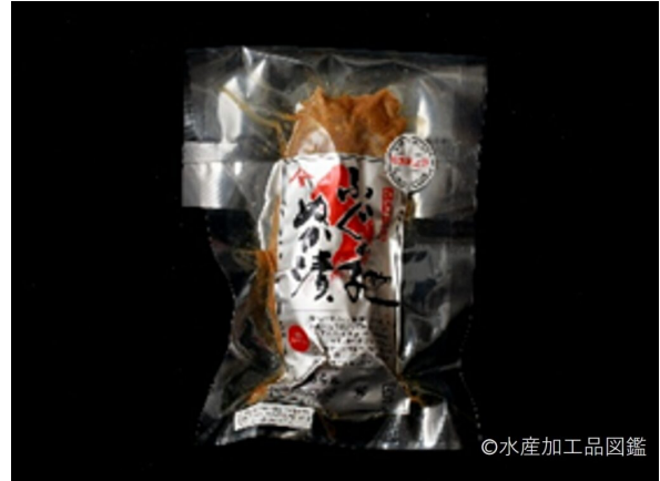
写真5 ふぐ卵巣糠漬け