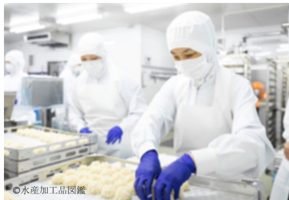
写真2 成形作業