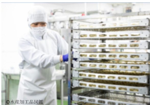
写真3 成形後、蒸し器へ