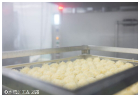
写真4 蒸し器で蒸し上げ中