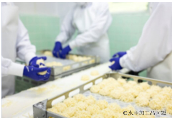
写真1 成形作業

状のしゅうまいの皮を表面全体にまぶす」等、手作業による成形作業にこだわりを持つ業者が多い（写真1，2）。