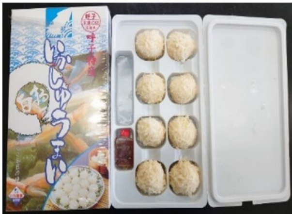
(いか道楽【有限会社 宮本水産】)