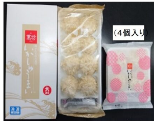
(呼子萬坊【株式会社 萬坊】)