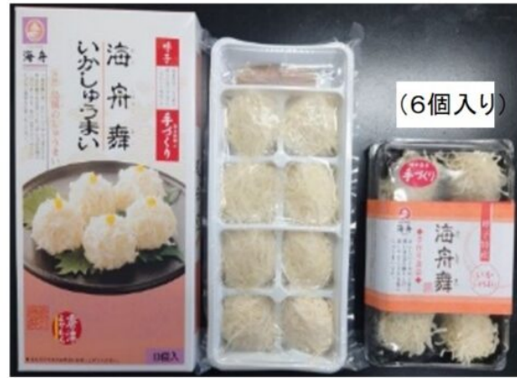
(玄海いか舟処 海舟)