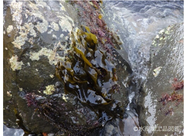
写真2 ハバノリ