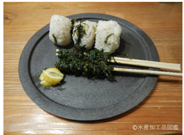
写真4 ホンダワラの串目割り箸使用