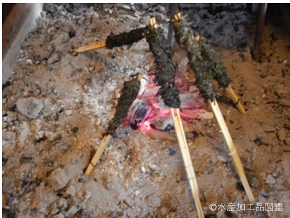
写真3 ホンダワラとアカモクの串目