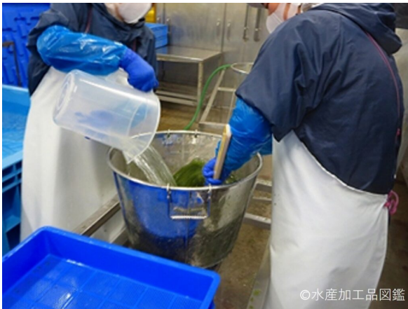
写真6 水切・冷却