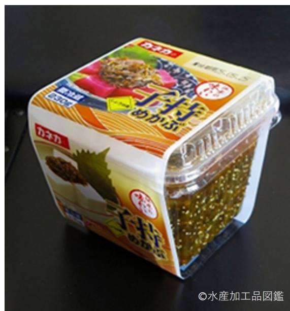
写真13 無調味製品