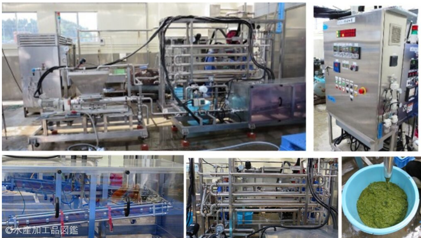
図3 海藻加工用通電加熱システム 左上：機械全体，右上：電源制御板，左下：リング電極式配管ユニット，中央下：冷却配管ユニット 右下：出口