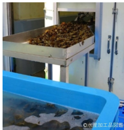
写真3 冷凍原料を解凍する様子