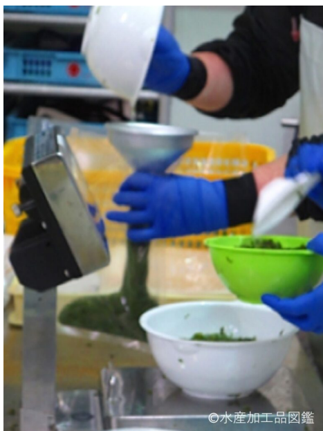
写真8 計量・充填