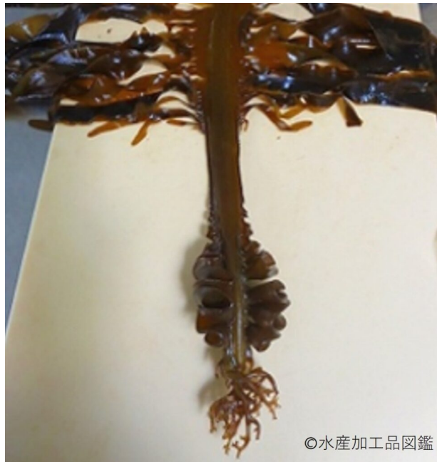
写真1 めかぶ加工品の原料となる成実葉の部位（※仮根の上部）