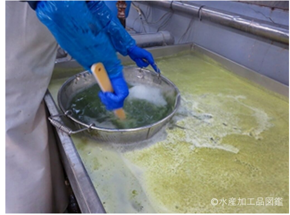
写真5 湯通し加熱