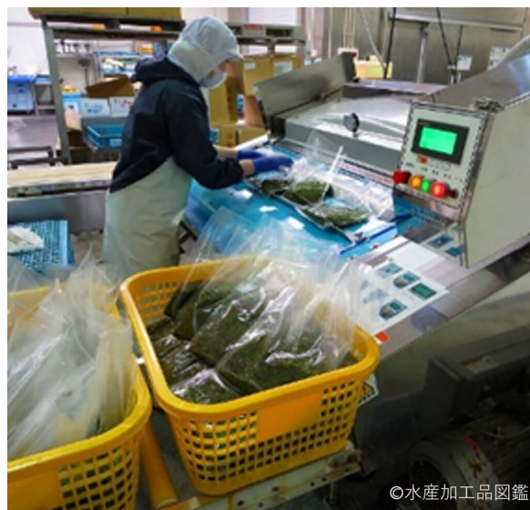
写真9 包装