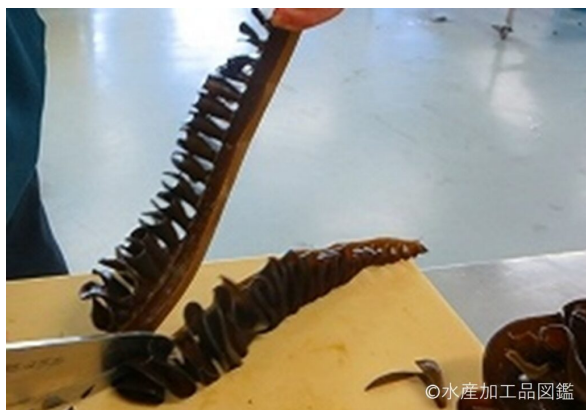
写真2 中芯除去 [メカブ分離]