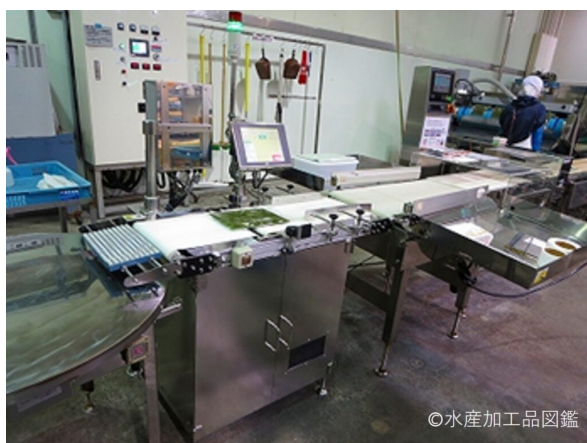
写真11 異物検査