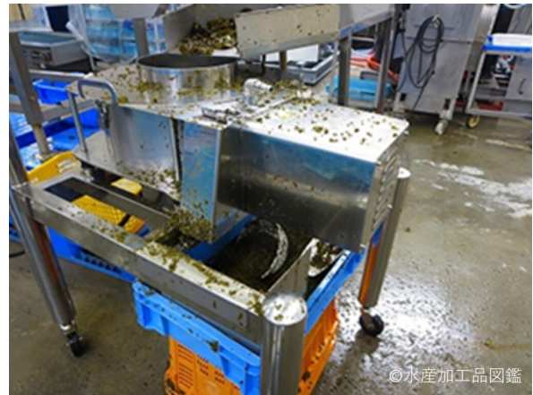
写真7 細切（スライス）