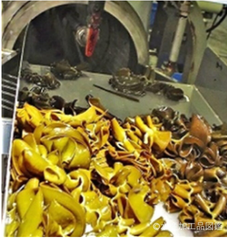
写真4 洗浄