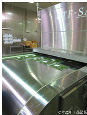
写真12 凍結