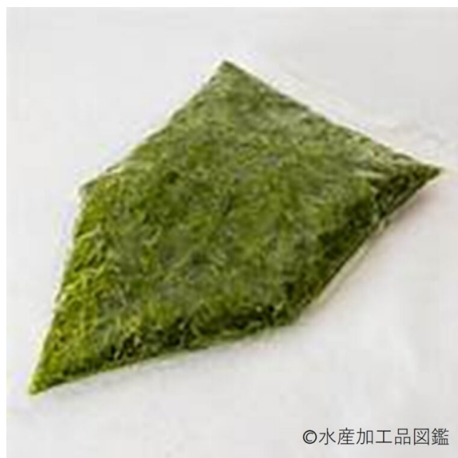
写真10 製品（業務用）