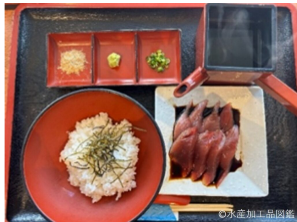
写真3 港の駅めいつで提供しているかつおめし