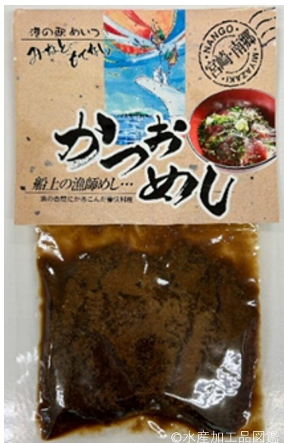
写真1 かつおめしの冷凍商品

茶をかける前の調味液に浸かった状態で真空包装し、冷凍状態で販売する（写真1）。生産地では食事処のメニューとしても提供される。