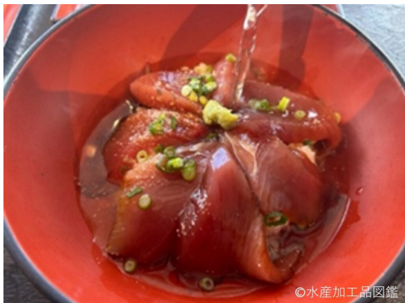
写真2 調理例

まずは刺身として食べ、その後白飯にのせ、出汁や茶、湯をかけて、青じそやごま、ネギ、わさびなどの薬味を加えながら味の変化を楽しむ。(写真2, 3)