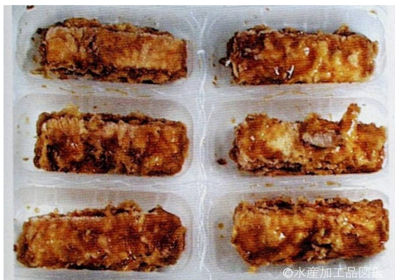
写真3 電子レンジ加熱形態の製品

電子レンジ加熱形態の製品(写真3)は、ポリプロピレン製のトレーに一定の個数を入れ、空気中の酸素侵入防止のため、アルミ蒸着したポリプロピレン外装材を用い包装されている。