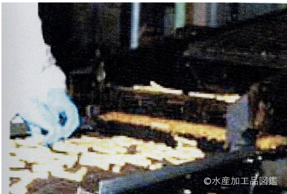
写真1 フライヤー