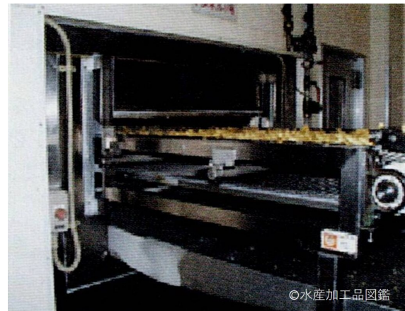
写真2 トンネルフリーザー入口