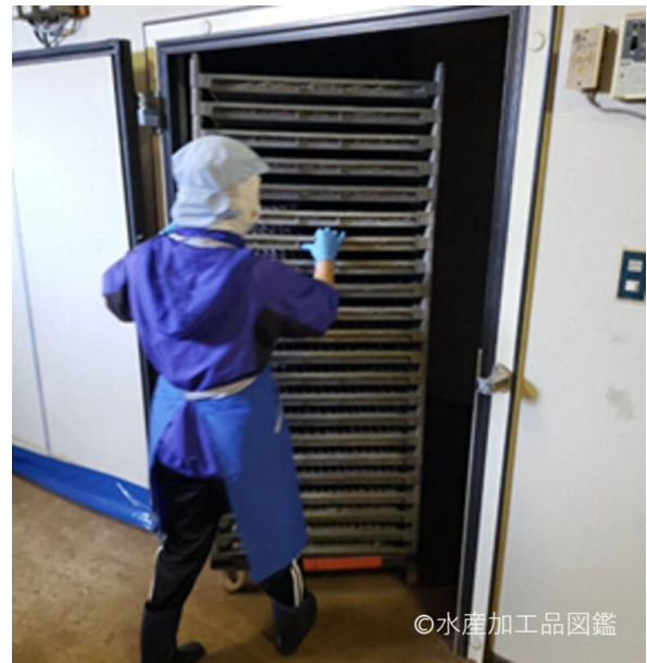
写真4 乾燥工程