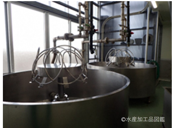
写真2 煮熟に用いる煮釜 ( (有)カネツル砂子商店協力、著者撮影)