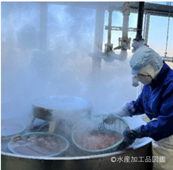
写真3 煮熟工程