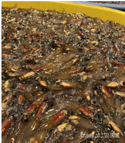
写真1 原料ホタルイカ