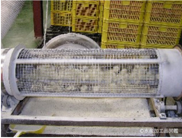
写真6 バリ取り工程