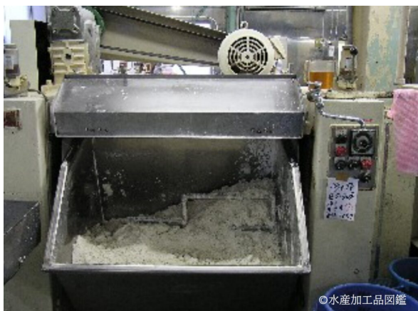
写真2 練り上げ・生地製造工程