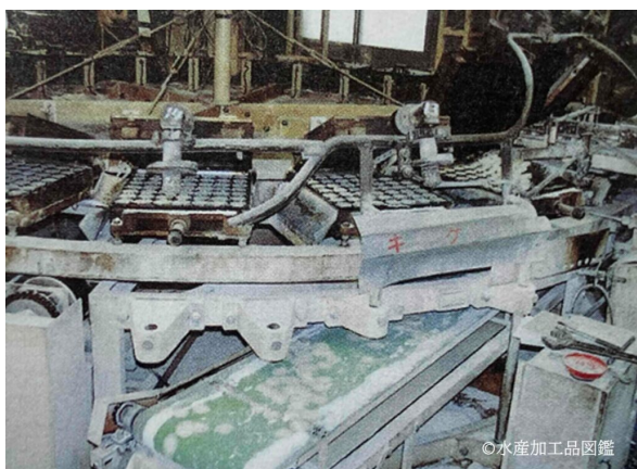
写真4 焼成工程（写真3とは異なる機械）