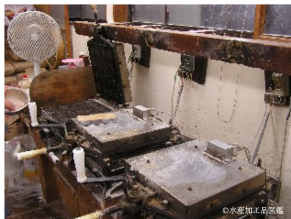
写真5 焼成工程（手焼き焼成機）