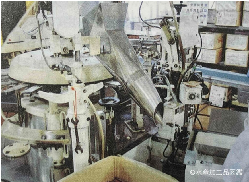
写真8 包装工程