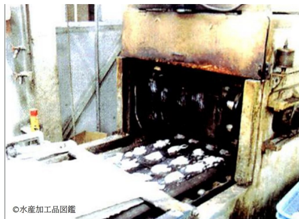
写真3 焼成工程