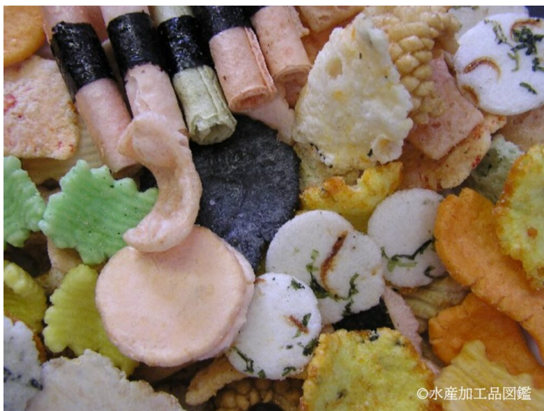
写真1 各種えびせんべい