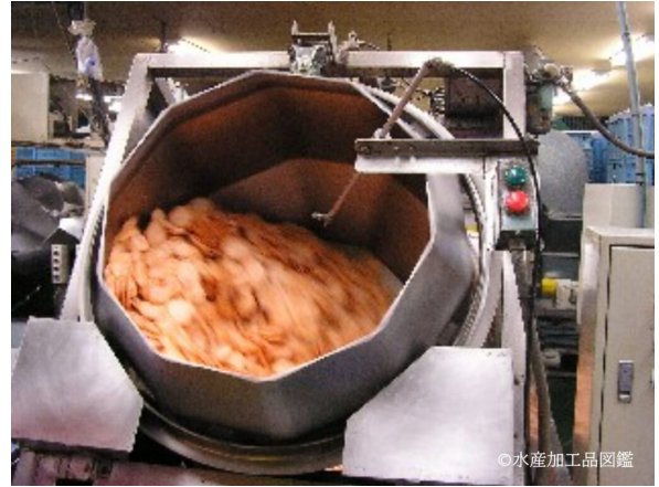
写真7 調味工程