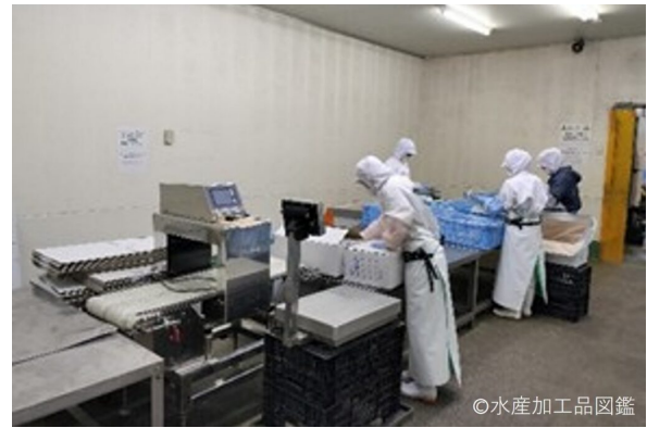
写真4 梱包工程