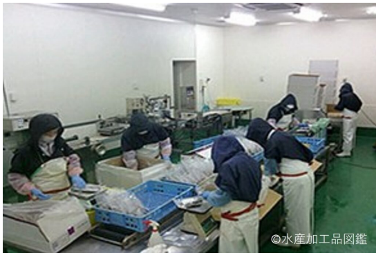
写真3 包装工程