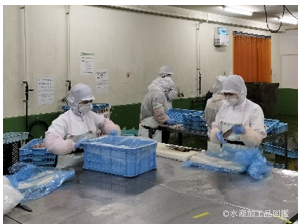
写真1 開き工程