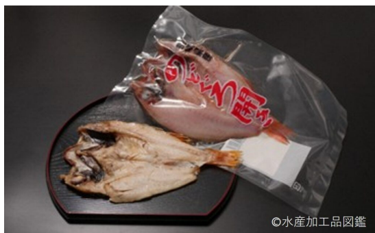
写真5 「長崎俵物」認定商品【のどぐろ開き】