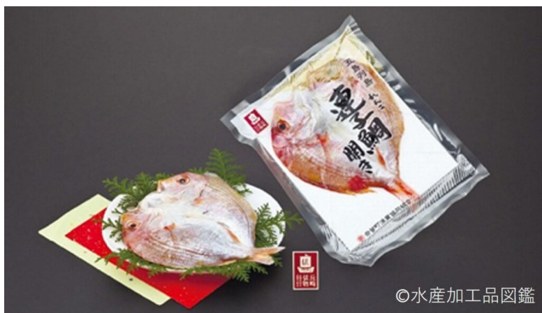
写真7 「長崎俵物」認定商品【蓮子鯛開き】