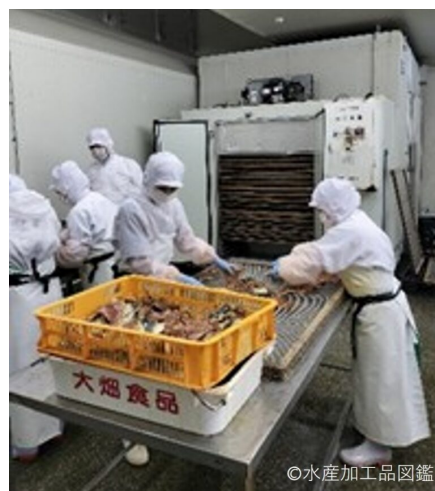
写真2 乾燥工程