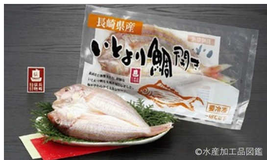
写真6 「長崎俵物」認定商品【いとより鯛開き】