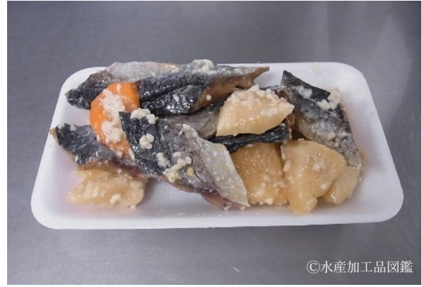
写真6 出来上がり