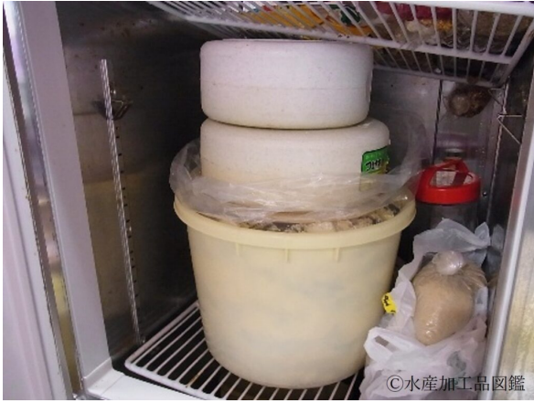
写真5 保管