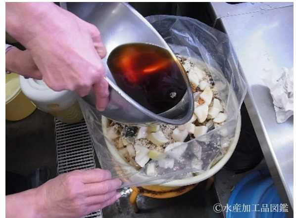
写真3 漬けこみ