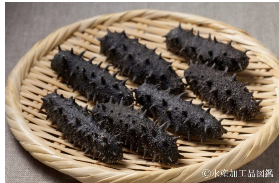
写真6 干しなまこ