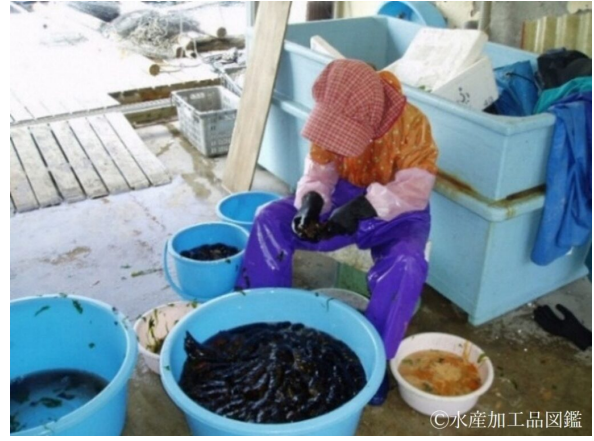
写真2 内臓除去の様子