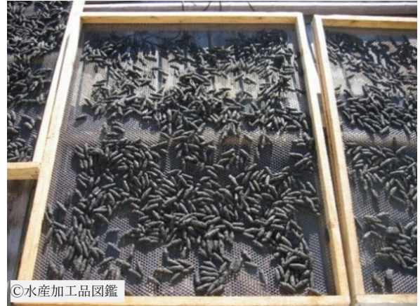
写真4 乾燥の様子