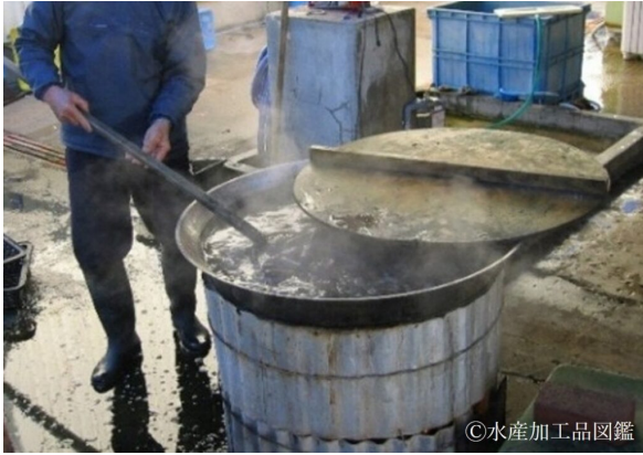
写真3 煮熟の様子