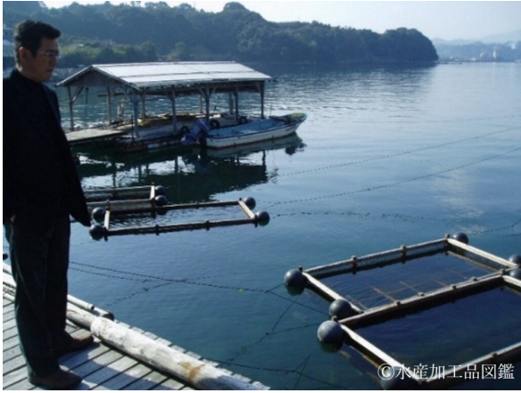
写真1 ナマコを蓄養する生簀