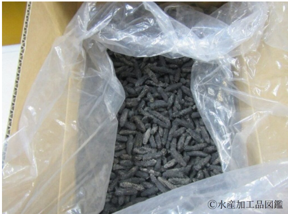
写真5 包装された干しなまこ：北海道産