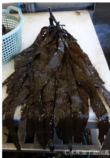
写真2 水戻し後のアラメ