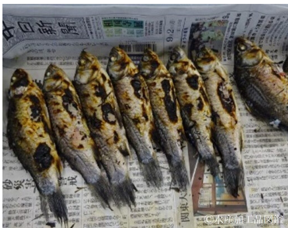
写真1 素焼き