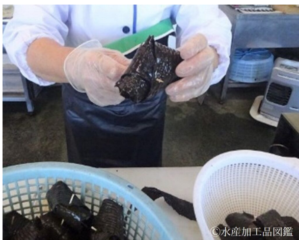
写真3 アラメを巻く作業