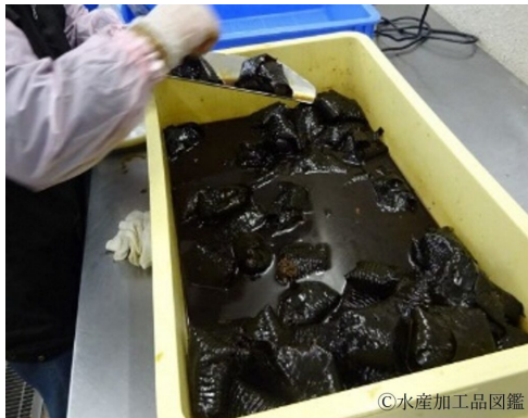
写真5 調味加熱後