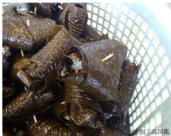
写真4 水炊き前