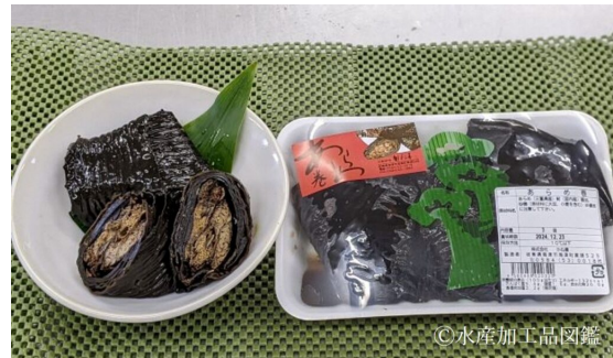
写真6 製品