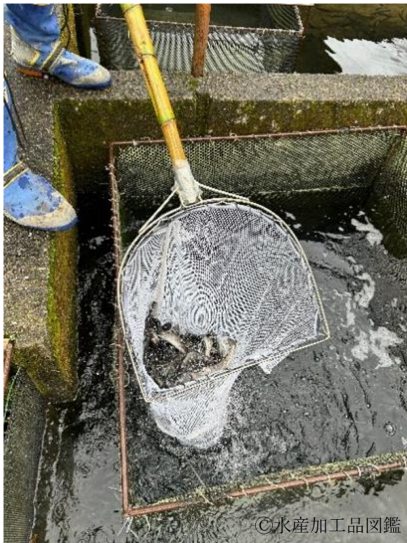
写真4 ヤマメの取上