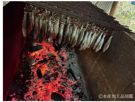
写真7 炭火で陪乾する