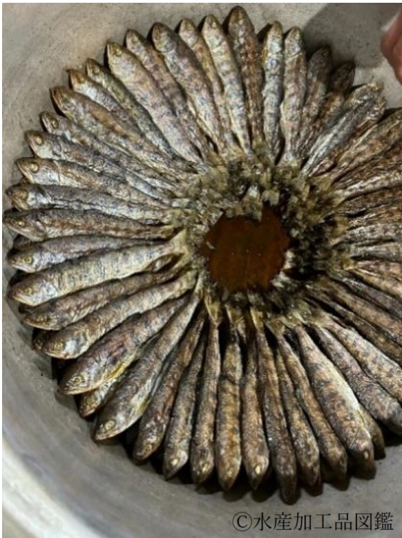
写真8 鍋に並べた様子