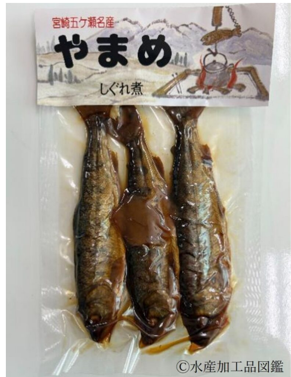
写真10 やまめ山椒煮