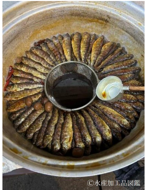
写真9 煮付