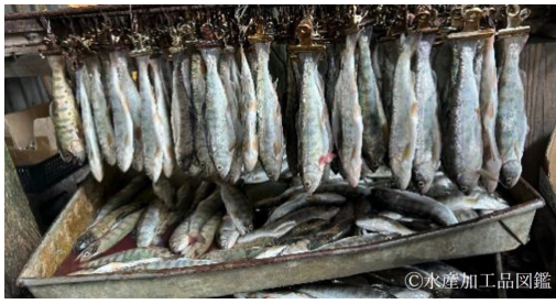
写真6 ヤマメを吊るした様子