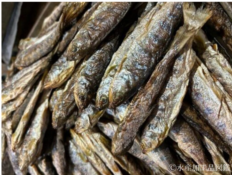
写真3 焙乾したヤマメ

宮崎県内の五ヶ瀬町で製造している甘露煮は炭火で焙乾する点が特徴といえる。炭火で遠火にして時間をかけて加熱することで、骨まで食べられる柔らかさになり、独特の炭の香りも楽しむことができる（写真3）。