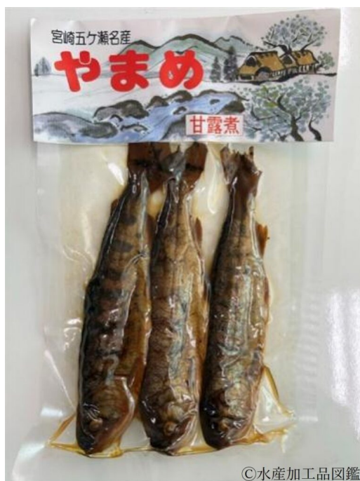
写真1 やまめ甘露煮