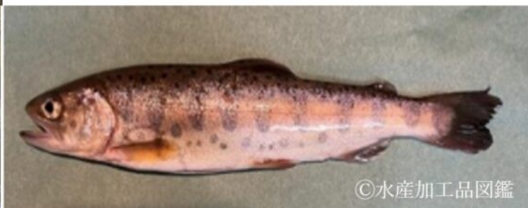
写真2 原料となるヤマメ