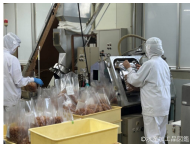
写真4 包装（窒素充填）