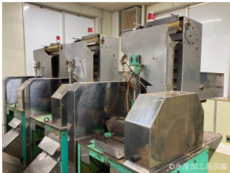
写真2 切削機