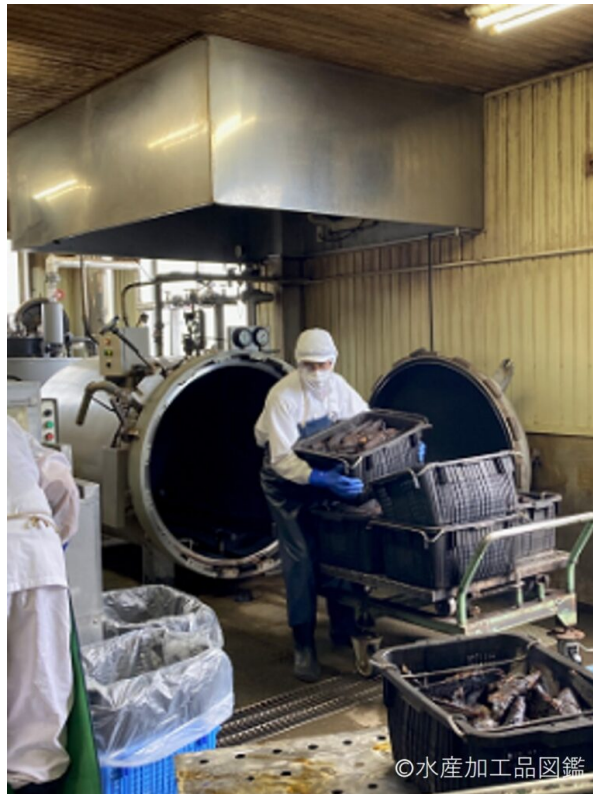
写真1 蒸煮