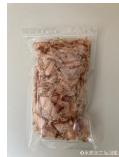
写真5 かつお削り節