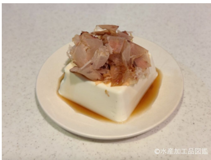
写真6 食べ方（冷や奴）

さば節や宗田節の削り節は、濃厚なだしをとることができるため、そばつゆのだしに使用されることが多い。また、おでんや煮物のように濃い味が求められる料理にも適している。いわし削り節は、味、香りの点でややくせがあり、みそ汁のだしをとるときに利用されることが多い。