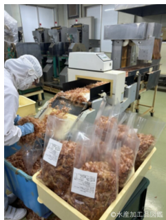
写真3 包装（パック詰め）