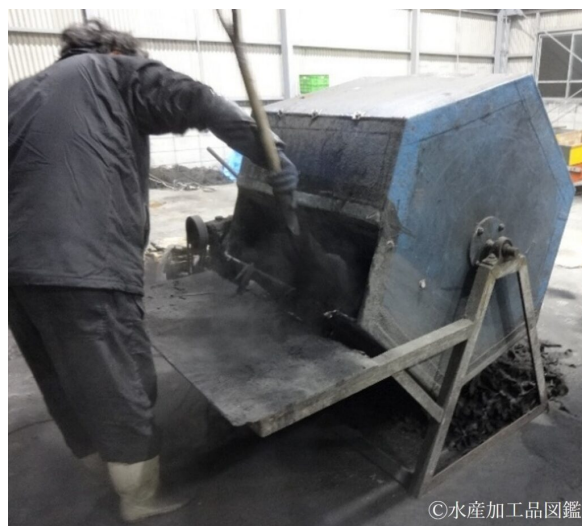
写真6 灰まぶし作業