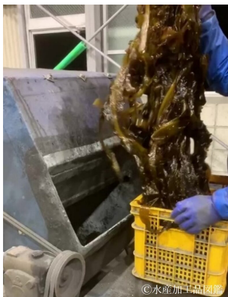
写真5 ワカメの投入作業