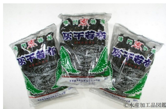
写真10 灰干しわかめ製品