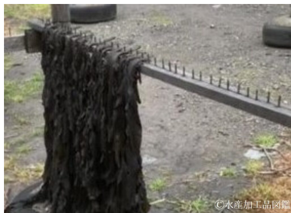
写真12 干し台