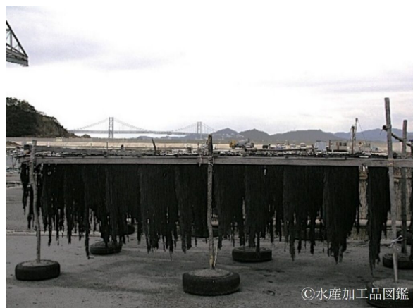
写真8 天日干し中の灰干しわかめ