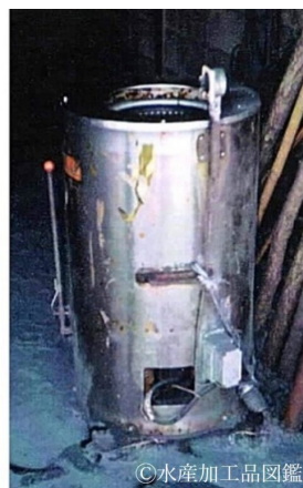
写真4 脱水機