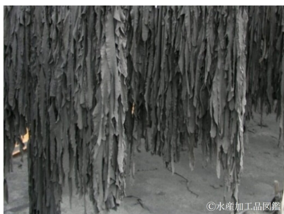
写真9 灰干しわかめ