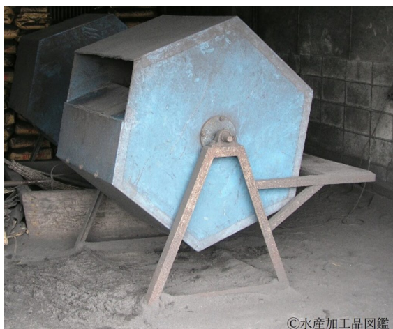
写真11 灰まぶしに使うもぶり機