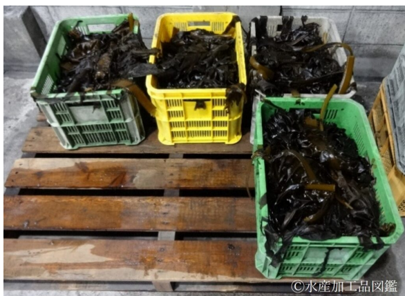
写真3 原料ワカメの水切り