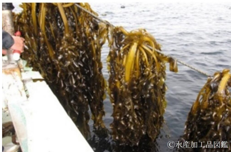
写真2 原料のワカメ