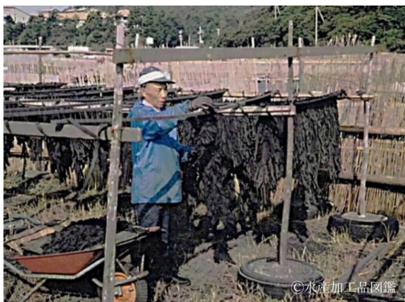
写真7 天日干し作業