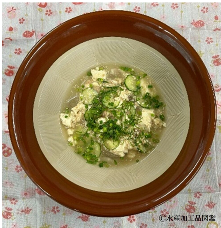
写真1 冷や汁