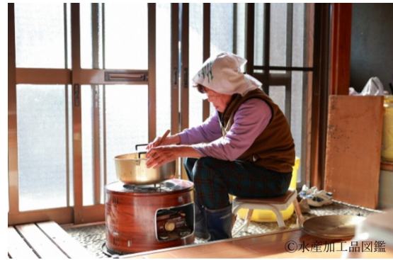
写真6 しょっからいわしを煮込む様子