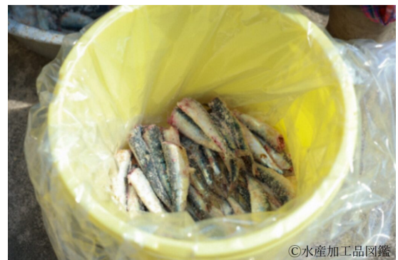
写真4 マイワシ塩蔵の様子