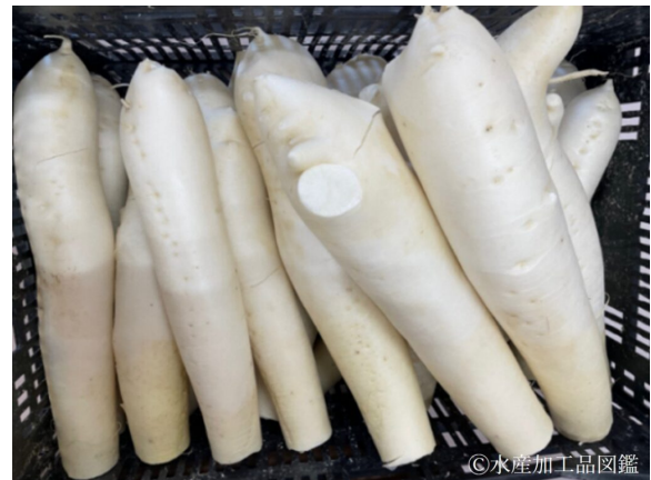
写真8 角田地区産の白首大根