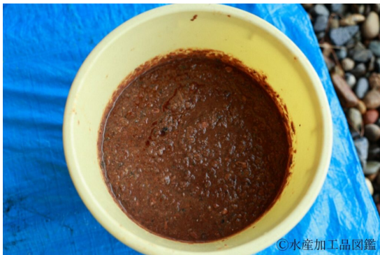
写真7 煮込んだ後の汁