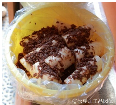
写真9 なまぐさごうこの漬け込みの様子