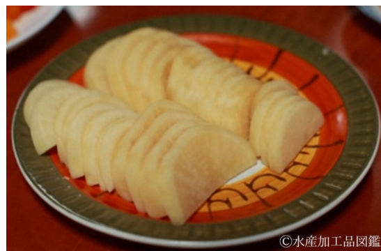
写真10 なまぐさごうこ