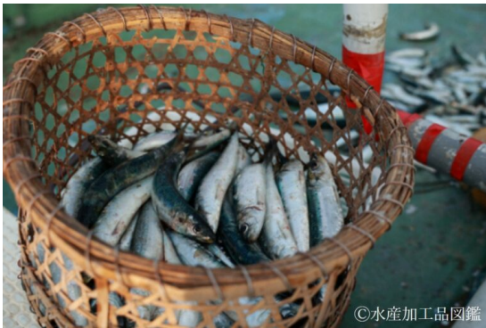
写真1 マイワシの水揚げの様子