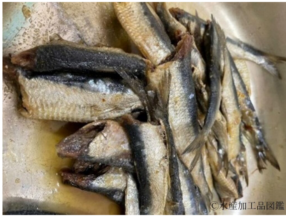
写真5 しょっからいわし