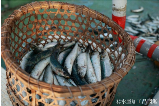
写真1 マイワシの水揚げの様子