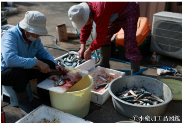
写真3 マイワシの下処理の様子