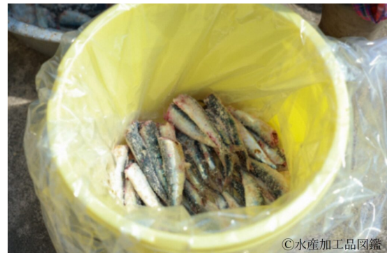
写真4 マイワシ塩蔵の様子