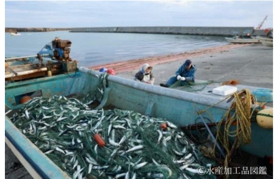
写真2 マイワシの水揚げの様子②