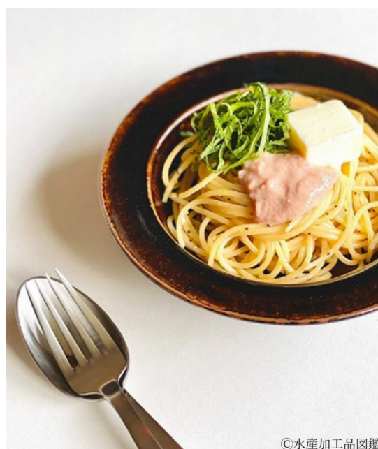
写真6 魚卵塩辛パスタ

一般的な塩辛類と同じように食されているが、パスタやチャーハンの調味材料としての人気も高く、パスタ専門店等で「魚卵塩辛パスタ」としてメニュー化されたこともある（写真6）。