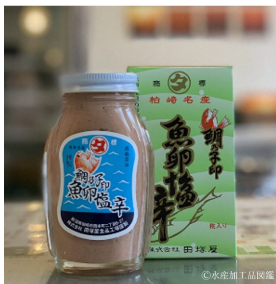
写真5 包装瓶と化粧箱

包装は120g入りの小びんに詰めてラベルを貼り、化粧箱に入れ製品とする（写真5）。