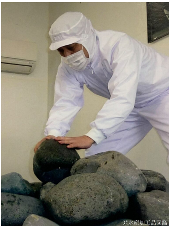
写真2 樽で熟成前に重石を均等に並べる