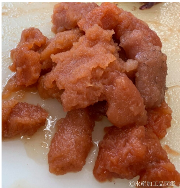
写真1 原料のマダラ卵

原料は、マダラの卵（写真1）を使用する。卵巣の表皮には色の黒い黒皮と黒くはない赤皮のものがあり、赤皮の卵巣はそのまま塩漬けをするが、黒皮のほうは皮をむき、塩漬けする。赤皮の卵巣は皮のついたまま塩漬けした方が脱水され良く漬かる。塩は沖縄の海水塩を使用している。また、適度に熟した卵を選ぶのが大切である。未受精卵や水っぽい完熟卵（水子）でなく、卵がしっかりしたものを選ぶことが重要であり、製造前に少量の卵をボイルして熟度を判断する。