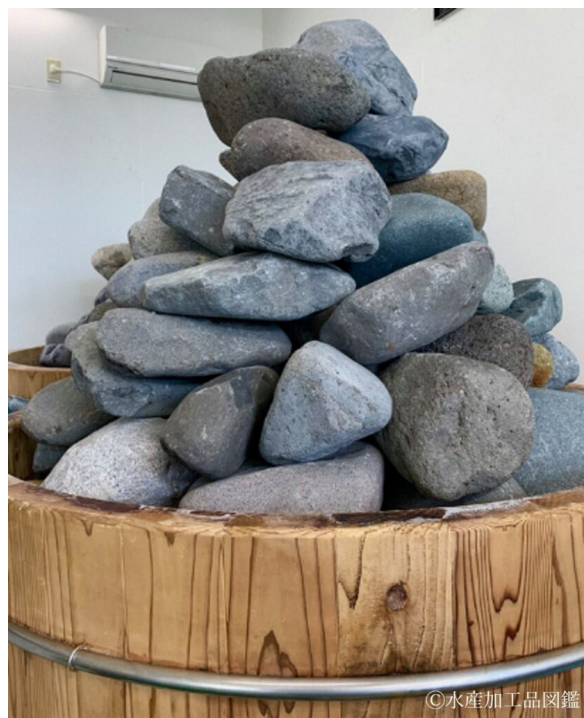
写真3 木製樽での熟成