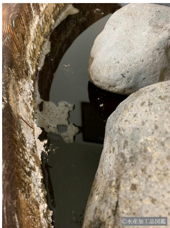
写真4 塩蔵後に浸出した魚醤