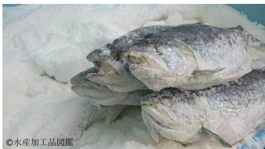
写真1 漬け込み後の様子

実際の漬け込み作業は、多量の天然粗塩を頭部、腹部および魚体表面の尾部から頭部にかけて軽く擦り込んで塩分の調整を行い、魚体が見えなくなる程の大量の塩を使用し、一尾ずつ層状に積み上げる(写真1)。10~11層に積み上げ、上部に重石を載せて加圧し(写真2)、余分な水分を除きながら漬け込む。これら作業を行うことで、身の締まり具合の良い、ギンザケ特有のうま味がある無添加にこだわった製品を造ることができる。