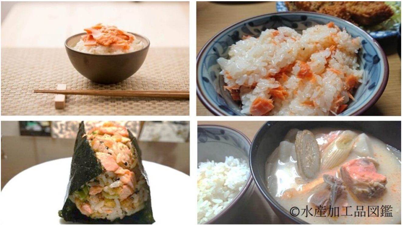
写真4 「夏汐」を使用した食べ方例

（著者：宮城県水産技術総合センター 鈴木 貢治・阿部 真紀子） （協力：末永九兵衛商店 株式会社 末永 陽市）