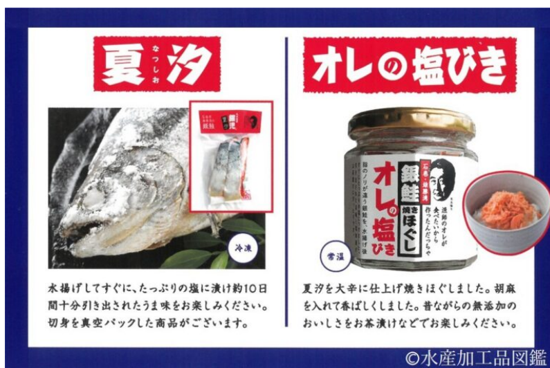
写真3 んざげ塩蔵品「夏汐」とその加工品

また、半身を利用した焼きほぐし(写真3右)は、瓶詰め殺菌により1年間常温保存が可能である。