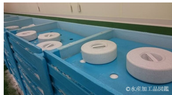
写真2 重石を載せて加圧する様子