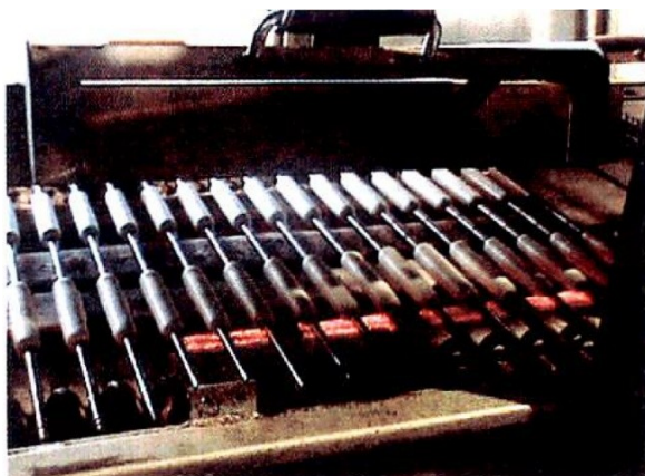
写真3 焙焼工程