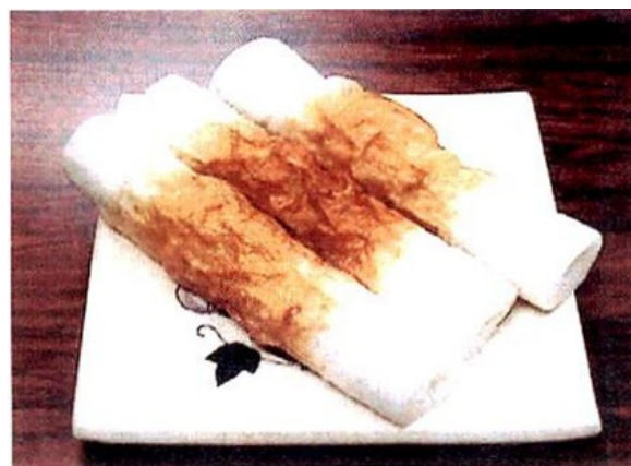
写真4 製品