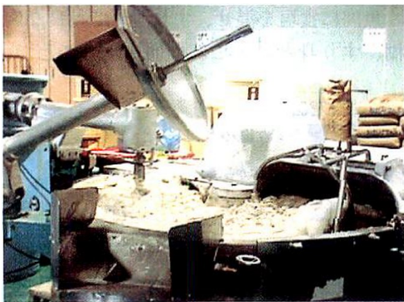
写真1 播潰工程